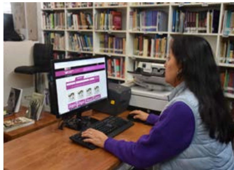
Registro de los documentos del Archivo PUM en la plataforma virtual del CDI LUM (2024).