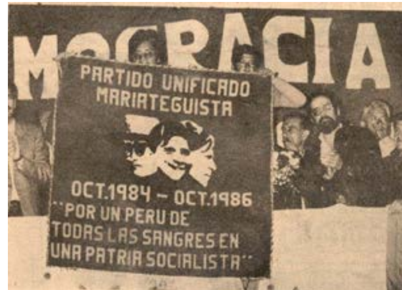
Reunión partidaria con motivo del segundo aniversario del PUM. Fuente: Amauta , 30 de octubre de 1986, p. 24.

Esto generó descontento entre sectores de izquierda, incluyendo a organizaciones gremiales y partidos políticos porque las decisiones tomadas en la ANP dependían de los delegados de cada organización, lo que llevaba a un amplio espectro de partidos de izquierda que generaban conflictos caudillistas. Por otro lado, gremios como la Confederación General de Trabajadores del Perú (CGTP), percibían que la