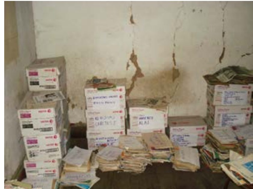
Situación del Archivo PUM previo al proceso de rescate documental (2008).

Bolognesi se dividió de la siguiente forma: en el primer piso funcionaba el PUM y en el segundo la CCP (Borja, 2023).