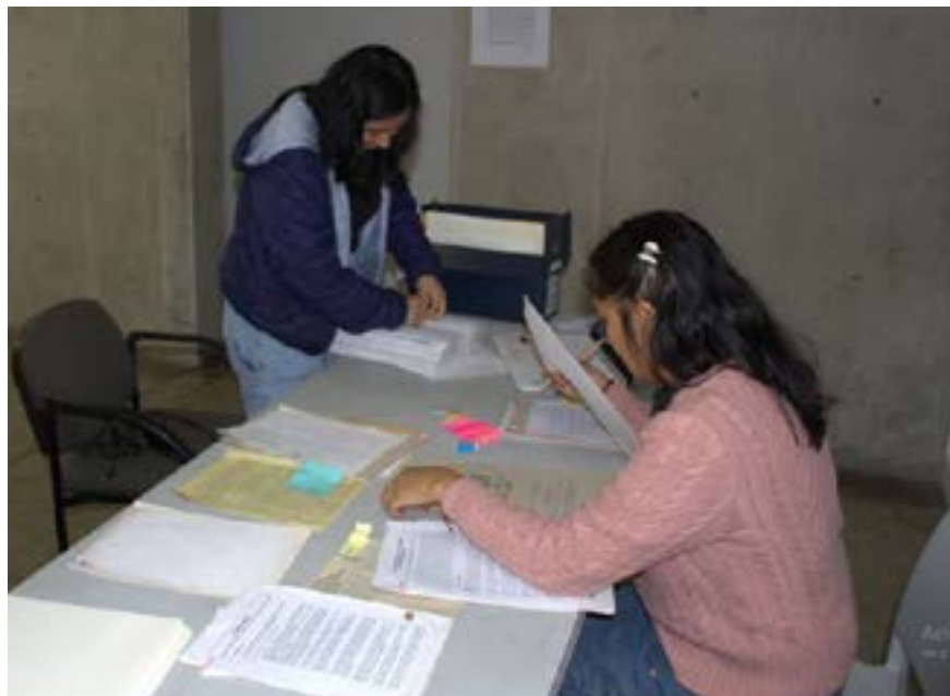
Equipo CDI LUM realizando la organización y descripción de los documentos del Archivo PUM (2023).