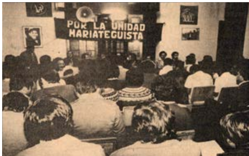
Unificación y conformación del PUM, mayo de 1984.

La constitución del PUM fue un esfuerzo planeado desde 1980 para consolidar un partido revolucionario de masas y se basaba en el incremento de los niveles de violencia y la percepción de una agudización de las contradicciones sociales en el país, sumados a varios procesos como la aparición de organizaciones terroristas, la intervención de las Fuerzas Armadas, la organización de los comités de autodefensa. En ese sentido, el PUM consideraba que era necesario llevar a cabo un trabajo político de masas para