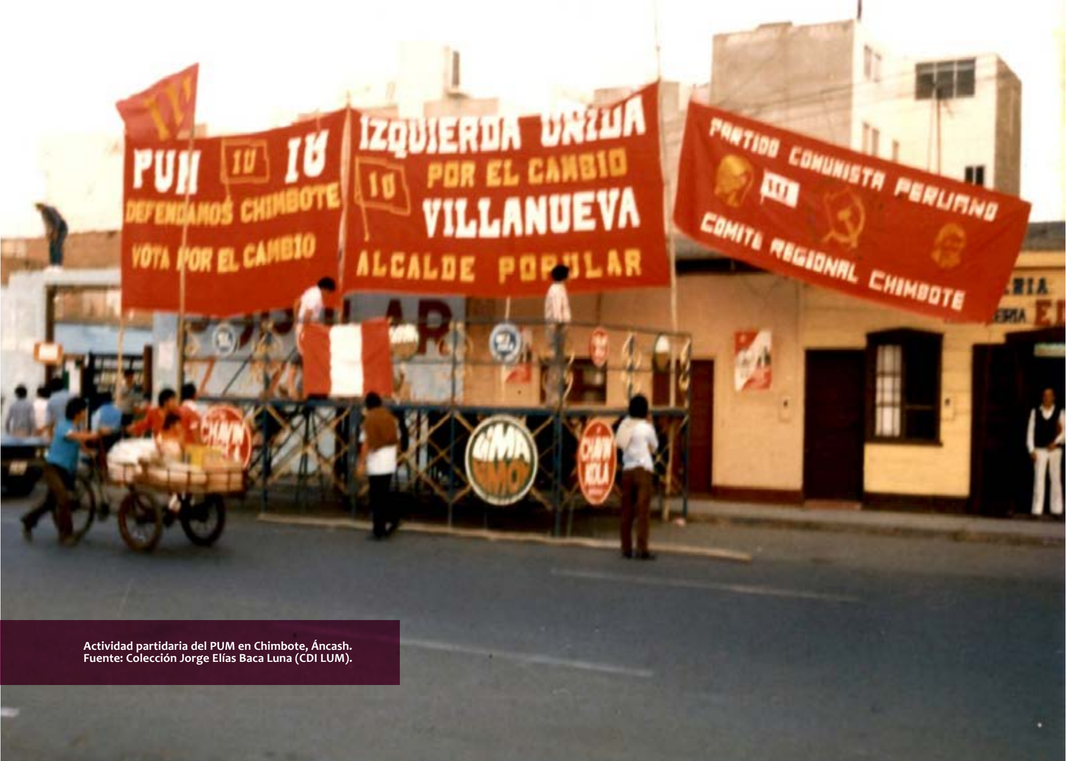
Actividad partidaria del PUM en Chimbote, Áncash.