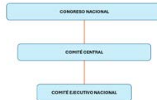
Instancias de la estructura partidaria del PUM.

Al examinar la estructura partidaria del PUM y su evolución en el tiempo, observamos que poseía tres instancias principales: 1) el Congreso Nacional (máximo organismo de dirección representativa y democrática del partido, encargado de tomar decisiones ideológicas y estratégicas), 2) el Comité Central (responsable de la dirección política del