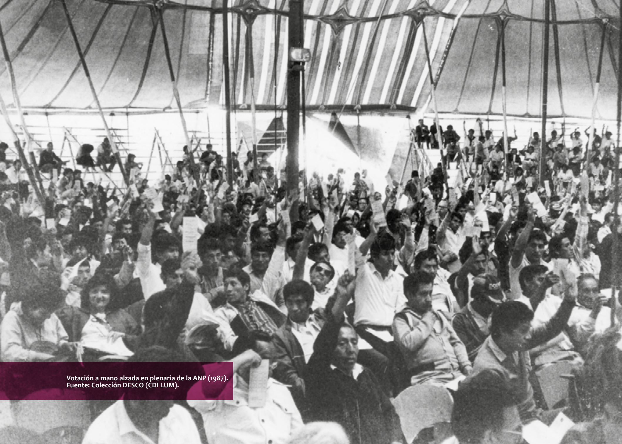
Votación a mano alzada en plenaria de la ANP (1987).