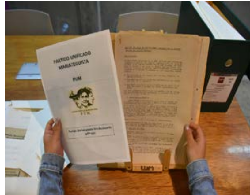
Usaria consultando los documentos del Archivo PUM (2024).