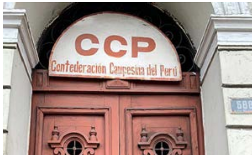
Portada del local de la CCP en Lima.

Los documentos partidarios fueron depositados en el local del PUM, ubicado en una casa de dos pisos en la Plaza Francisco Bolognesi, centro de Lima y no estaban organizados de acuerdo a los criterios archivísticos. Pasaron de mano en mano, entre cuadernos, mochilas y escritorios, mientras se utilizaban como parte de las actividades diarias del partido. Durante el gobierno de Alberto Fujimori (1990-2000), varios dirigentes resguardaron personalmente la documentación o la destruyeron para evitar las represalias del régimen (Borja, 2019). Esto significa que muchos documentos quedaron en custodia y nunca llegaron al Archivo PUM. Su centralización era una necesidad no solo desde el punto de vista administrativo sino también para hilvanar la historia partidaria, siendo Javier Diez Canseco, una de las principales figuras políticas que bregó para que el Archivo PUM fuese conservado en el local institucional. En ese sentido, más que un archivo preexistente, el Archivo PUM fue