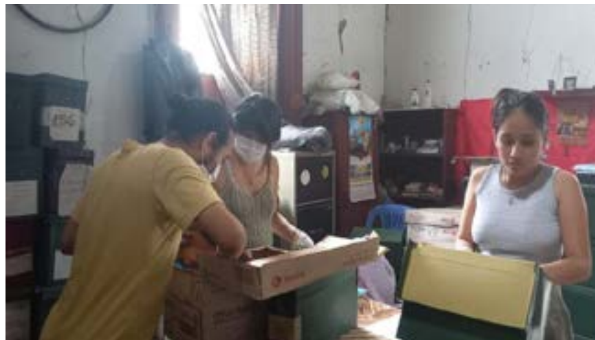
Equipo del CDI LUM seleccionando documentos del Archivo PUM para su organización (2023).