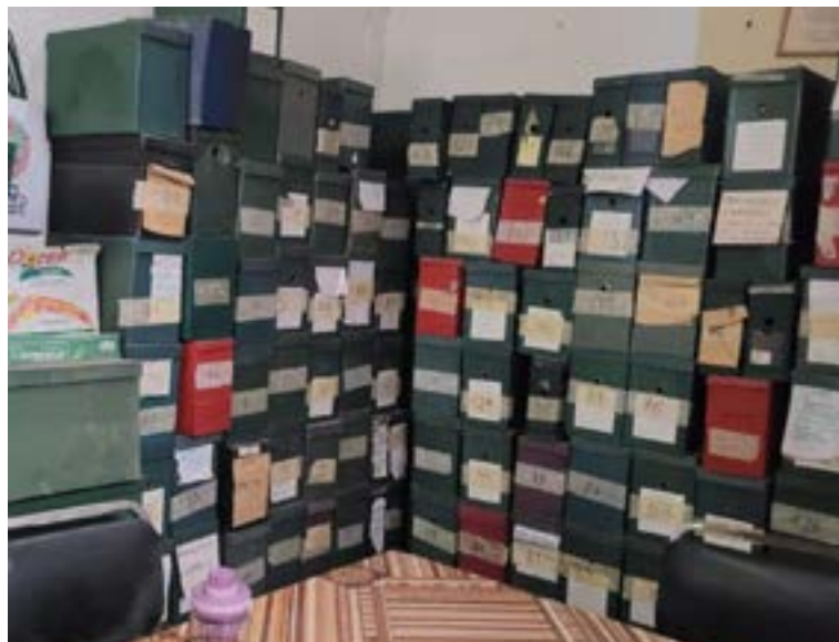
Cajas con documentación del Archivo PUM organizada por Ruth Borja y estudiantes sanmarquinos (2018).