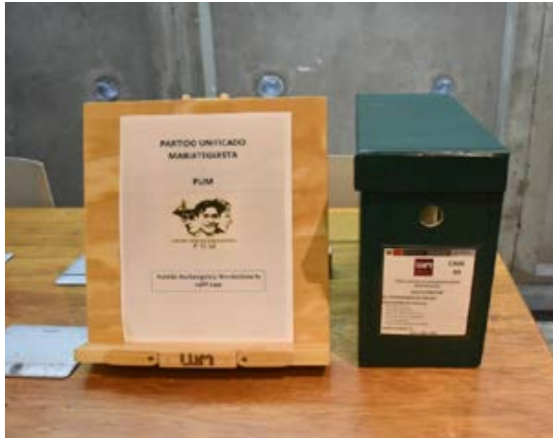
Documentos del Archivo PUM organizados y puestos al servicio del público (2024).