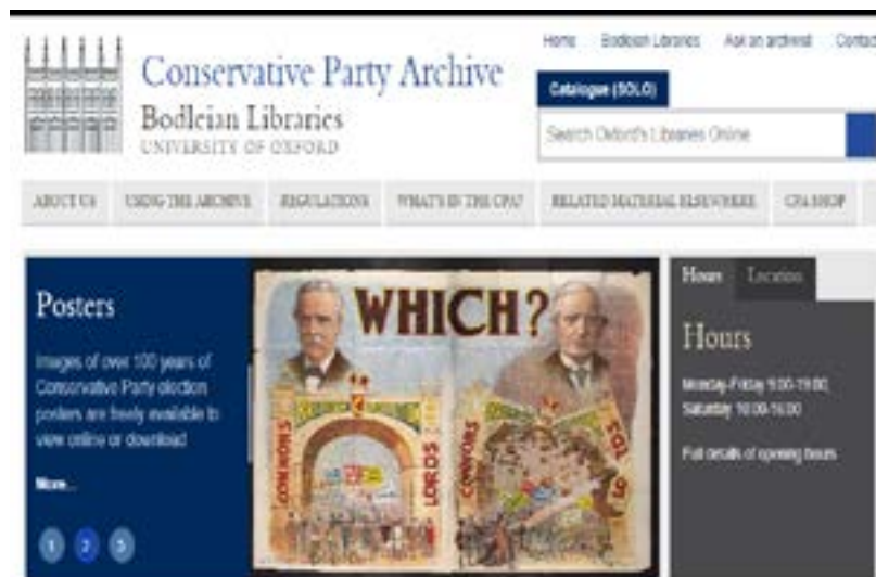
Vista de la plataforma virtual del Archivo del Partido Conservador de Gran Bretaña. Fuente: University of Oxford (2024).

La decisión de una organización política de conservar sus archivos no solo expresa su deseo de preservar el pasado, sino también representa su voluntad por organizar su presente. La documentación partidaria es útil para conocer el registro de las actividades institucionales, su evolución e hitos históricos, identificar los debates y discusiones, los liderazgos nacionales y regionales, su relación con otros actores del Estado y la sociedad. Además, albergar y custodiar un archivo revela (o intenta ocultar) el contexto político vigente: sus problemáticas, desafíos y tensiones. Entre algunas experiencias de acceso público a estos archivos, contamos con la documentación producida por el Partido Socialista Obrero Español y otras organizaciones de izquierda en el contexto de la Guerra civil española. En Gran Bretaña, el Partido Conservador ha depositado sus materiales más antiguos en la Universidad de Oxford, brindando atención en diversos horarios. Para América Latina contamos con el Centro de Documentación e Investigación de la Cultura de Izquierdas, con una colección sobre partidos políticos, especialmente Argentina (Jelin 2002, pp. 1-2; Vázquez de Parga y Sierra Barcena, 1997, p. 60; University of Oxford,