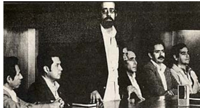
Congreso de unificación que culminó con la fundación del PUM, mayo de 1984.