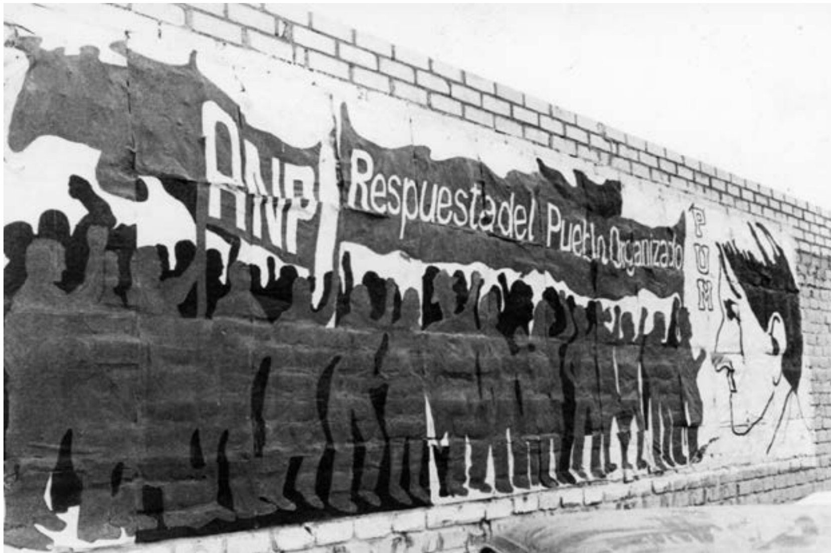
Mural en alusión a la Asamblea Nacional Popular.