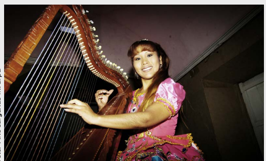
Foto: Vine cargando mi arpa