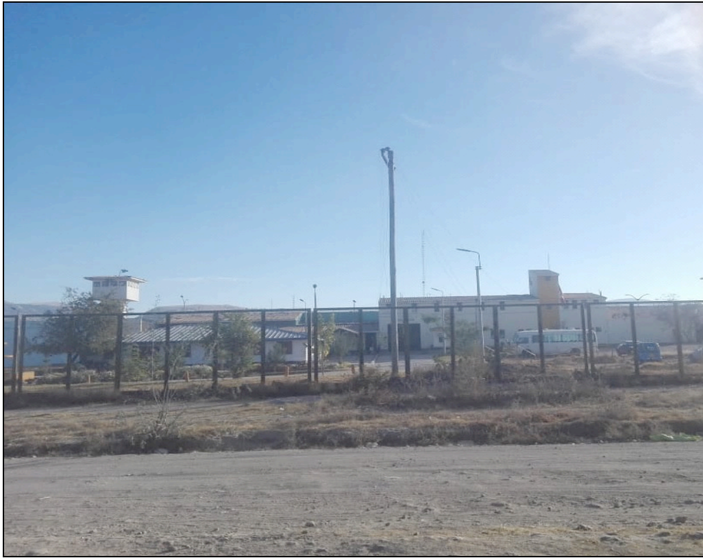
- Jr. Callao No. 215, Interior A: