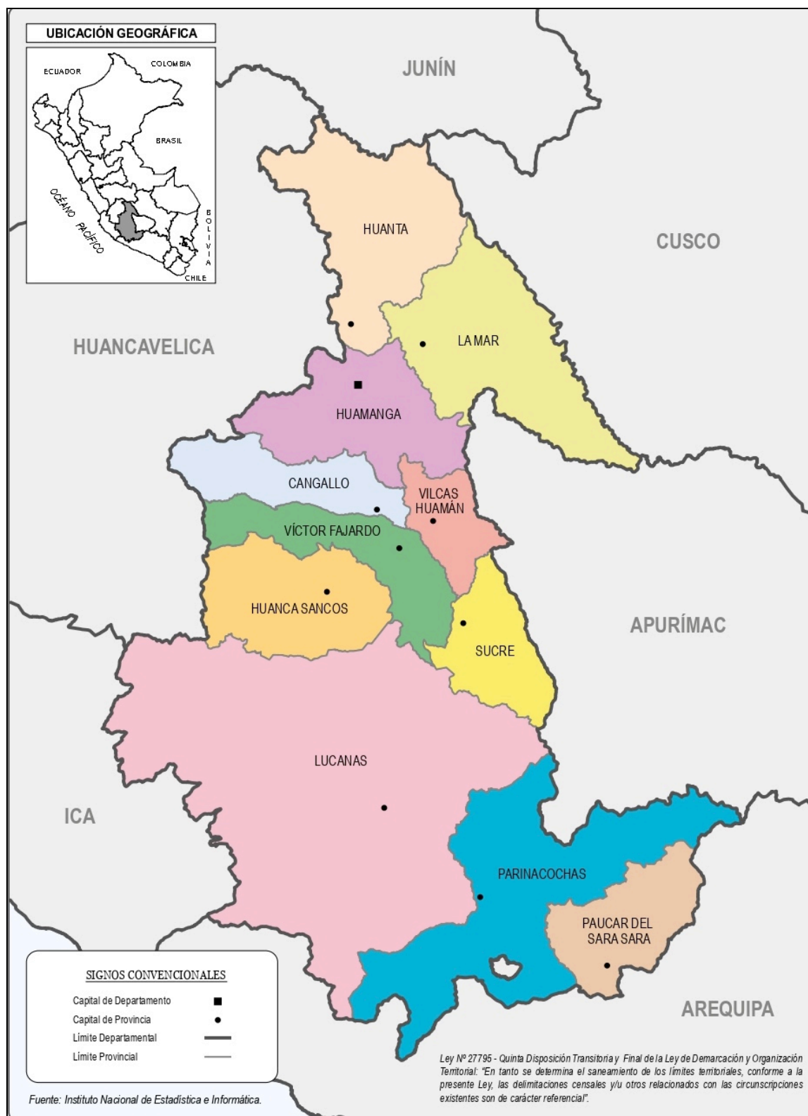
Imagen emitida por el Instituto Nacional de Estadística e Informática en el año 2019.