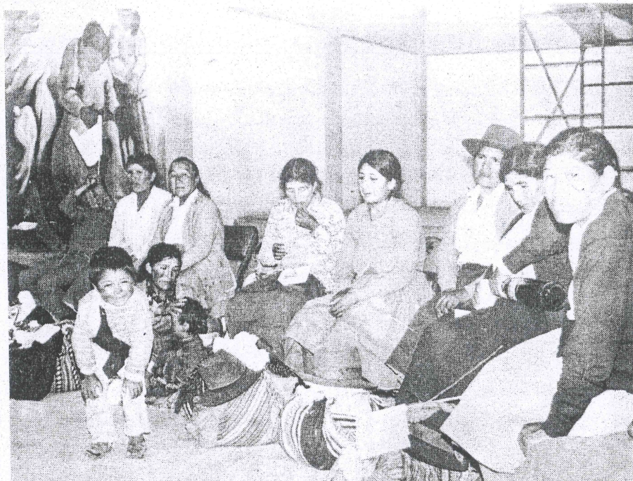
Las mujeres toman conciencia de la necesidad de organizarse

La "opción preferencial por los pobres" —como opción evangélica— corresponde a la Iglesia en su conjunto, pertenezcan ellos al mundo obrero, o a los ambientes profesionales o empresariales. "Los pobres no pueden esperar", decía el Santo Padre Juan Pablo II en su reciente visita pastoral a Chile.