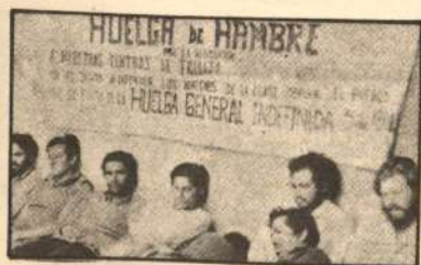
"Silva, Oporto y 10 cc. en huelga de hambre; peligran sus vidas"...

Esta entrada del campesinado a la lucha, a no dudarlo, terminará por producir una importante variación en la correlación nacional de fuerzas y será en favor de la revolución si se sigue una correcta táctica.