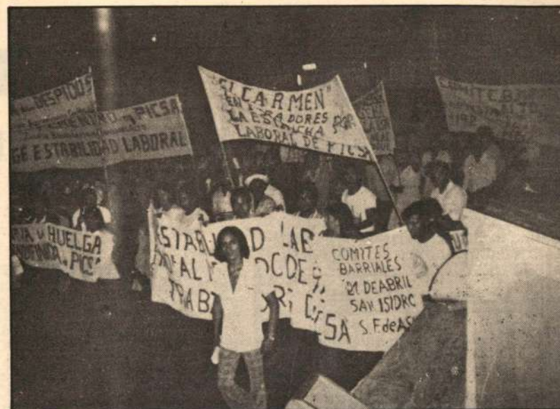
“¡No al despido masivo! ¡A luchar, a vencer! Picsa en Huelga Indefinida...”

El curso ascendente de las luchas populares camina a una nueva medida de combate. El alza popular urbana, luego de los paros nacionales de Julio de 1977 y Febrero de 1978, camina hacia una medida superior, a la vez que el campesinado se sacude de un temporal reflujo y retoma las masivas acciones de tomas de tierras. Es en estos combates que estamos acumulando las fuerzas políticas de masas que nos permitan afrontar victoriosamente todas las tareas que nos exige la lucha por el poder.