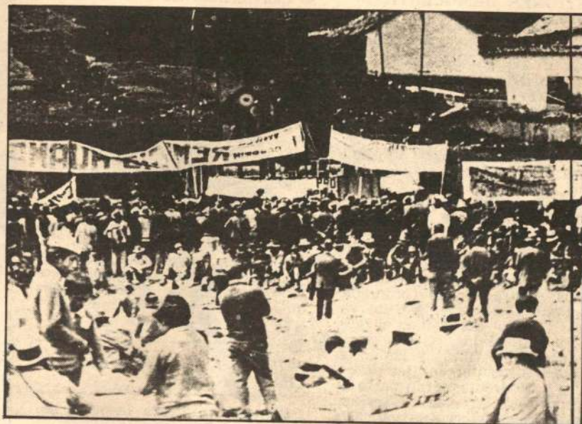
"Contra despidos, persecuciones... EXITOSO PARO NACIONAL MINERO"...