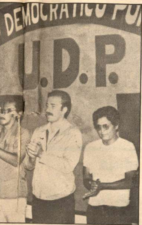
an con los 4,000 asistentes las consignas de

las bases, integrándose plenamente sindicatos como el de Hierro Perú, no hay duda que en las luchas que se avecinan ocupará su puesto de vanguardia.