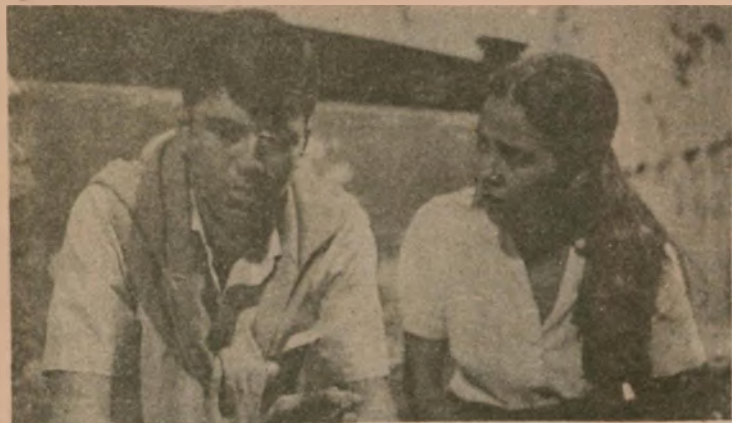
"La Ciudad y Los Perros" será proyectada en el Auditorio San Vicente.

— LA JUVENTUD FRENTE AL EMPLEO fue el tema que reunió a más de 170 jóvenes el día 24 recién pasado en la municipalidad de Comas, reunión que antecedió a la jornada sobre DROGADICCION, CAUSAS Y CONSECUENCIAS que se llevó a cabo en el mismo local, y cuyas conclusiones se pueden encontrar en la municipalidad del distrito que, además, cerró la jornada con una interesante mesa redonda sobre JUVENTUD Y CAMBIO, debate que reunió a las juventudes del PAP, de la IU y de la Unión de Jóvenes Cristianos. — LAS CONFERENCIAS SOBRE TUPAC AMARU por un nuevo aniversario se realizarán los días 31 de octubre y 4 de noviembre en la Biblioteca del municipio a las 18.00. El mismo día 4 a las diez de la mañana, se realizará una concentración cívico-popular en homenaje a Túpac Amaru, estando presentes delegaciones de todos los colegios de este populoso distrito.