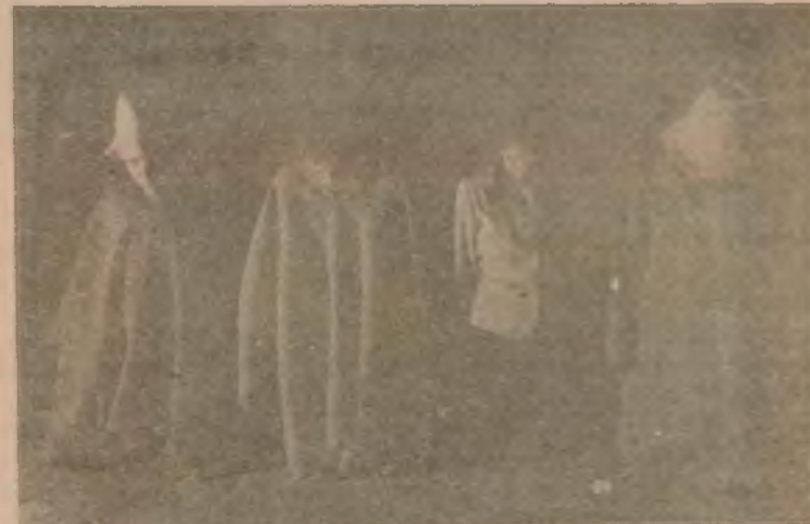
El Grupo "Setiembre" repone "Luis, Bandolero, Luis"