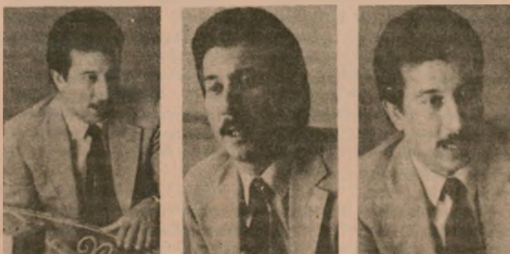
“Nicaragua se ha convertido para los EE.UU. en una obsesión que tiene que destruir...”

Cuando hablo de crear un clima de desestabilización hablo del objetivo de conseguir un apoyo interno que hoy no tienen, de minar la conciencia de nuestros trabajadores que son el pilar de la Revolución, porque al hacerlo