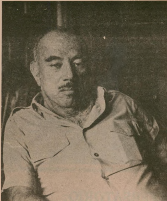
“...y llegamos al convencimiento de que ya no éramos apristas, mejor dicho que ya no éramos reformistas, sino revolucionarios...”

Es en febrero de 1964, en un discurso en la Plaza San Mar-