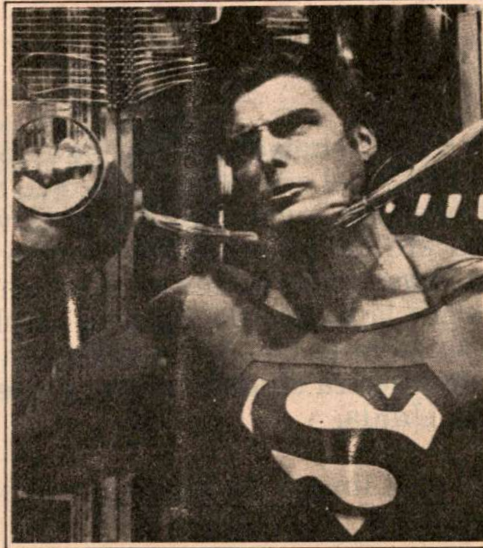
Christopher Reeve en "Superman" de Richard Lester

una comicidad por partes, la aventura sigue siendo sin embargo demasiado desganada como para que tenga un mínimo interés comprobar que va sucediendo. Librarse de la insostenible Louise Lane por un filme, volver a Superman malvado, son las dos novedades argumentales que Lester desaprovecha, por dedicarse exclusivamente a diseñar va s ingeniosos con que probar que ridículo es el asunto. Los desaprovecha, porque Superman malo sigue siendo demasiado tonto como para generar algún tipo de humor un poco más afinado: todo se limita a algunos chistes más o menos pesados, y nada más. La inversión total de Superman que cabía esperar, y que hubiera servido para poner de manifiesto, aunque fuera de soslayo, lo esquemático del personaje "bueno", no se da. Richard Lester se ríe de su historieta, pero no tanto. No tanto como para hacer una buena película, y quizás perderse la dirección de un previsible Superman IV .