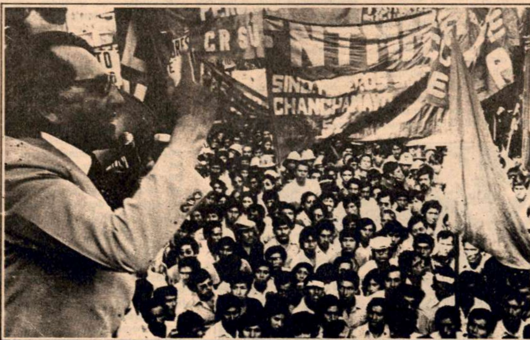
"Tengo mis reservas sobre la sinceridad democrática de varios líderes de la izquierda"

—Le temería a esa posibilidad, pero creo que es imposible ser un "mandarín" en el Perú. Por mucho prestigio que tenga, un intelectual llega sólo a un sector pequeño de la población y su tarea en ese sector es contribuir a despejar nubes, a intentar que hayan más realismo y mejor información, en torno a los problemas sociales. Esa es una labor sana y uno debe contentarse con ella si la puede cumplir.