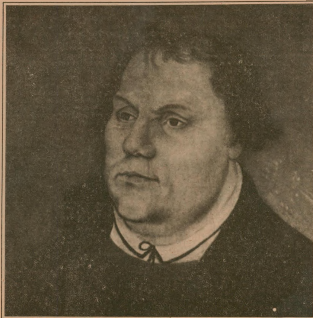
Escuela de Lucas Cranach el Viejo

A comienzos del siglo XVI, dos formas de pensamiento se oponían con toda claridad. De un lado se encontraban los realistas, los que asumían el dogma en un nivel de realidad posible en la abstracción y, por tanto, resumida en el arquetipo. Para los realistas, el Verbo, al encarnarse, se hizo Hombre (con mayúscula), sin asumir los defectos, vicios o debilidades propios de cualquier hombre y transformándose, por tanto, en un arquetipo de ideal humano. Para los nominalistas, sin embargo, los arquetipos no existen, y, por tanto, Cristo, al encarnarse, se transformó en un hombre, lo que resulta prácticamente incomprensible. Comparados a separar la razón de la religión, para poder aferrar-