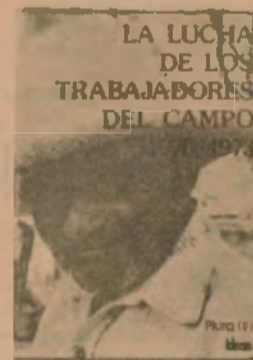
— La lucha de los trabajadores del campo 1970-1973.