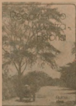
— Recordando nuestra historia.

SERIE: "PIURA LA TIERRA DE LOS SOLES FUERTES Y EL ALGARROBO"