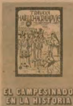
— El campesino en la historia.

En un justo homenaje al Día del Campesino, IDEAS presenta algunas publicaciones que son producto del interés y la dedicación al estudio del agro y su problemática. Estas publicaciones buscan ser instrumentos de ayuda al trabajo de educadores, trabajadores sociales y promotores.