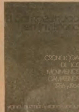
— Cronología de los movimientos 1956-1964.