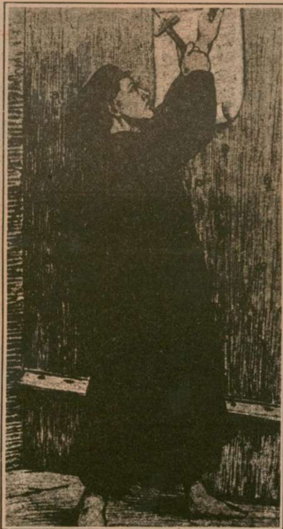
Lutero, en 1517, clavando sus 95 tesis contra el comercio de indulgencias en la iglesia de Wittenberg.

A pesar de todo esto, de su simplismo, o quizá por ello, la doctrina luterana tuvo un éxito muy rápido. No podemos olvidar que en el hecho de la rebelión misma y sus motivos (negociado de las indulgencias para financiar la basílica de San Pedro) había un fondo social importante. Este se puso de manifiesto en la guerra campesina de Alemania, donde Thomas Münzer, un verdadero revolucionario de la época, pretendió establecer una especie de comunismo cristiano, en el que no sólo se cuestionaba la autoridad de la Iglesia, sino —lo que era aún más importante— toda forma de autoridad instituida, aniquilando toda forma de opresión social.