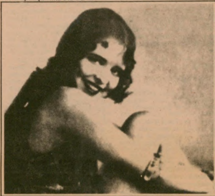
La simpatiquísima Clara Bow.