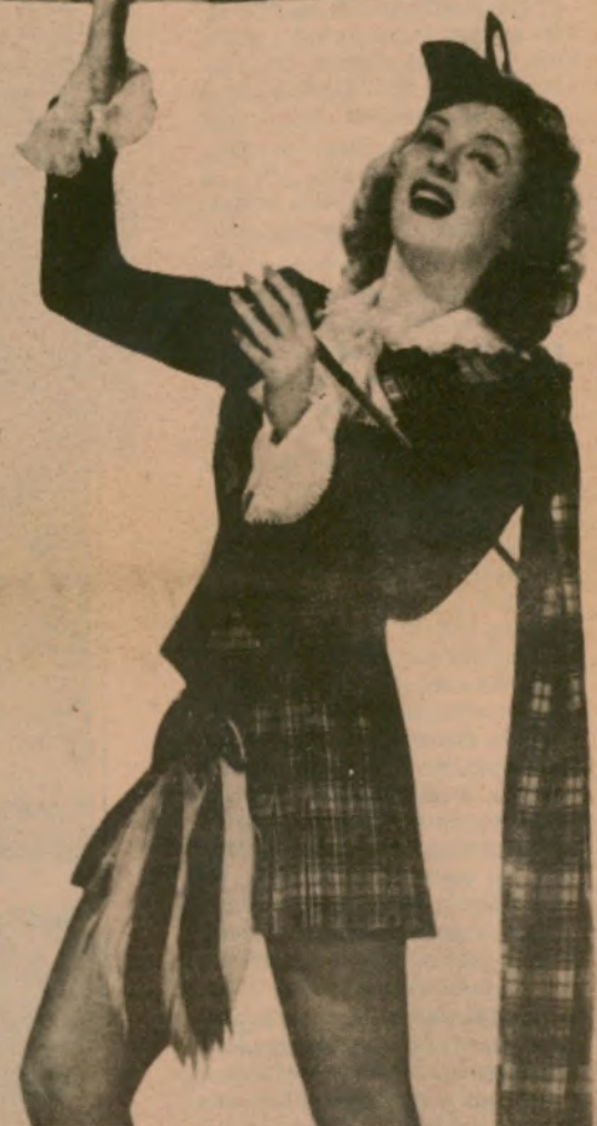
En la noche del pasado, eran los años dorados de la Metro-Goldwyn-Mayer. En las fotos Ronald Colman y Greer Garson.