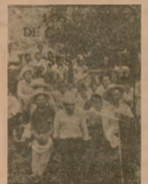
— Los comités de campesinos pobres: sus luchas.

Pedidos a: PUBLIREC Jr. Huamachuco No. 1927 - Telf. 233234