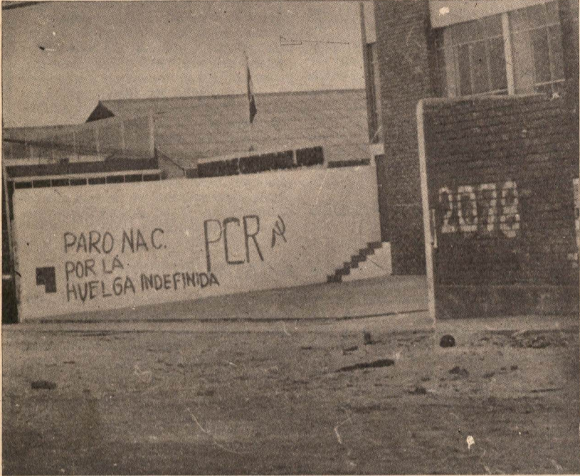
La unidad de todo el pueblo en apoyo a los compañeros mineros en lucha, es la tarea del momento a lo largo y ancho del país.

La dictadura ha sido duramente golpeada por la heroica huelga minera. Han sido zarandeados sus planes hambreadores y entreguistas. La profusa propaganda de la OCI en torno a la supuesta pérdida diaria de millón y medio de dólares por la huelga, expresa, por encima de cálculos o veracidad del asunto, que los planes del FMI, que el gobierno defiende a toda costa, se han visto afectados.