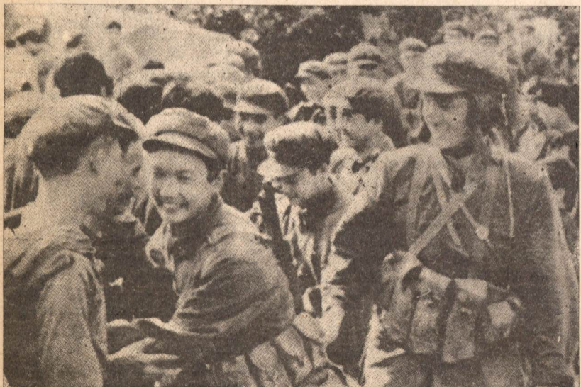
Pobladores vietnamitas confraternizando con soldados chinos en circunstancias previas al retiro de las tropas chinas. La contraofensiva punitiva y limitada del ejército chino no estuvo dirigida al pueblo vietnamita, sino contra la camarilla hegemónica que lo gobierna.

No otra es la intención de la URSS al vetar la propuesta de Paz y retiro de tropas que se hizo ante la ONU. Vietnam y Rusia se alistan para desplegar un operativo de venganza contra el pueblo Kampucheano. Habiendo sufrido un duro golpe político y militar por parte de China con su acción punitiva, habiéndose puesto al descubierto el contenido reaccionario y de agresión de la invasión vietnamita y habiéndose traído por los suelos