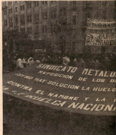
Como en setiembre del 78, la lucha minera ha cogobierno APRA-Dictadura.