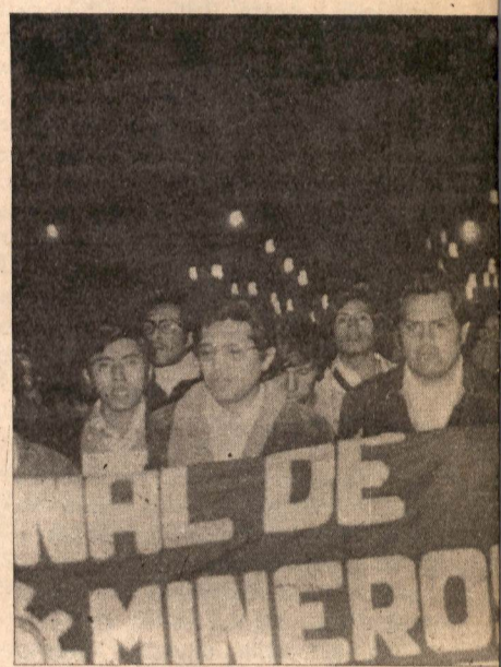
Las luchas de los mineros, del SUTEP, de enfiteuyen el eje reactivador de masas que está por reaccionario.

Las bases sindicales de la Refinería de Ilo, la deminas Canarias, la de San Juan de Chorunga, las de San Vicente de Chanchamayo, la de Caudalosa Grande, y muchas otras que se han sumado al paro nacional minero del 3-4 abril, han ratificado en la lucha que apoyan a su Federación Minera y a su actual dirigencia clasista. No hay mayor respaldo de bases a una dirigencia que la que la propia lucha muestra. De ahí que las pretensiones de la dictadura militar de ilegalizar la FNMMP o de los traidores como Díaz Chávez de corroer la unidad clasista de la misma, caen en el mas absoluto vacío. El paro nacional minero ha sido una muestra de unidad en el combate y de amplísima solidaridad clasista con las reivindicaciones levantadas por los mineros de la Southern Perú Copper Corporation (SPCC).