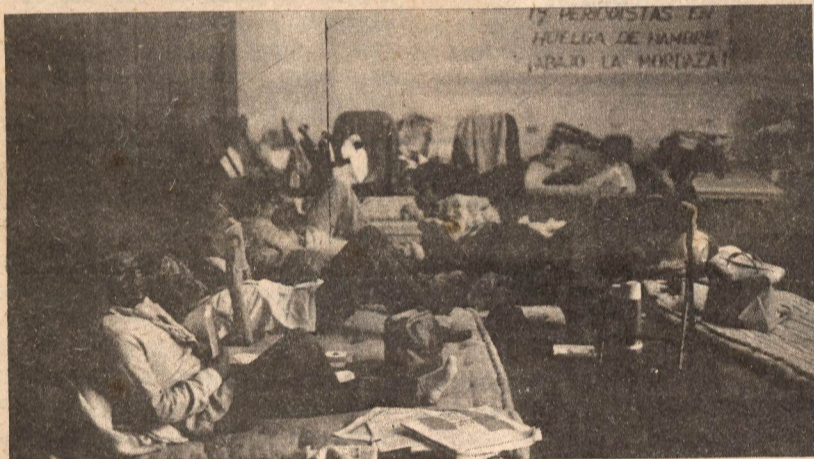
17 periodistas en Lima y otros que se van sumando en todo el país, es una de las formas de lucha que hoy adquiere la defensa de la libertad de prensa en el Perú. CAUSA OBRERA se solidariza plenamente con ésta lucha y exige la inmediata reapertura de las revistas y semanarios, entre ellos CLASE OBRERA.