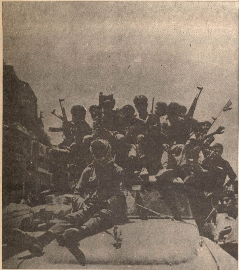
Los pueblos del mundo han denunciado el acuerdo reaccionario y proimperialista firmado entre Israel y Egipto. Para el pueblo Palestino queda totalmente claro, que sólo su lucha armada independiente y prolongada le garantizará sus derechos nacionales y la ansiada paz.