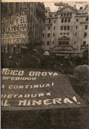
ace estremecer el país y desespera