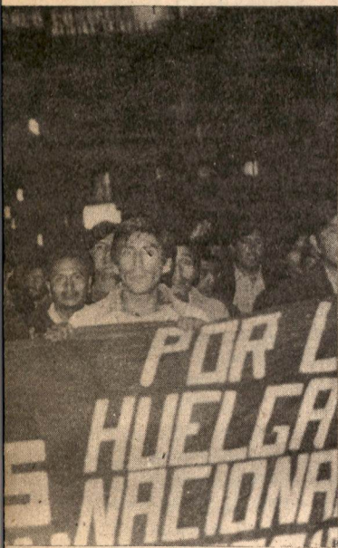
Primeros, de los periodistas, consi- diendo en serios aprietos al pacto