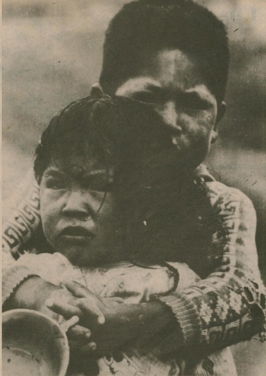
"Generaciones enteras son afectadas de por vida en su desarrollo físico y cerebral"

MBRE PUEDE SER SO- O. DEPENDE DEL EPENDE DE QUE EL DERROQUE A LOS ARIOS Y SE ORGANI- DER REVOLUCIONA-