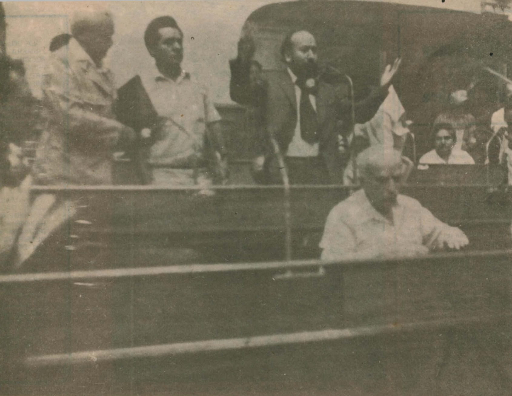
La bancada de izquierda se retira de la plenaria del Martes 27 en protesta por la no reapertura de las revistas clausuradas.

Así es la vida, ahora hasta los bufalillos menores compiten y se serruchan el piso entre sí.