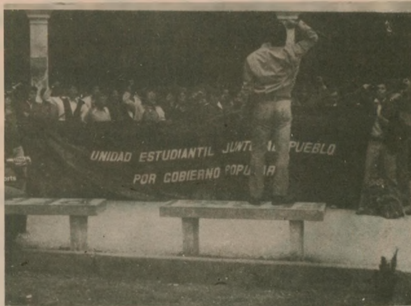
La JCR a la cabeza de las movilizaciones estudiantiles contra la política educativa de la dictadura y por mayores rentas para la Universidad.

j.O.: En estos momentos, los estudiantes de Medicina de San Marcos -Promociones 1977 y 78-, han tomado el local de San Fernando exigiendo mejores condiciones de estudios y reestructuración del curriculum; los estudiantes de la UNI demandan a la Asamblea Universitaria la reposición de los estudiantes expulsados; los cc. de Apurímac exigen el reconocimiento legal de la Universidad; en las Universidades Particulares (Garcilazo, San Martín y otras) se viene preparando un nuevo combate contra el desmedido alza de pensiones. En todos estos lugares, las masas vienen librando duras batallas