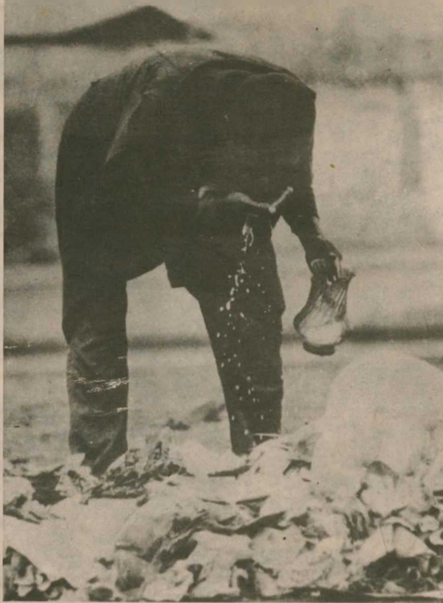
En el país están anulados los Derechos Elementales de Salud.

Mientras el Plan del FMI y la Dictadura, golpea de esa manera el trabajo y la capacidad adquisitiva de las mayorías, abiertamente favorece a un puñado de grandes empresarios y de empresas imperialistas. El conjunto de sus medidas apunta a ello. Su eje centrado en ampliar la industria de exportación no tradicional, pretendiendo repetir la experiencia de Taiwan, Chile, etc. no sólo llega tarde a la guerra comercial en la economía internacional y hace totalmente vulnerable a nuestro país respecto a sus fluctuaciones, sino que exige una drástica reducción de los costos, en particular salariales y se basa en la restricción consciente del mercado interno, nacional. Sólo así puede pensar en competir con mercancías producidas en otros países. Por si esto no bastara, debe dar amplias facilidades a empresas imperialistas para que instale sus industrias y saqueen nuestros recursos naturales, cumpliendo aquellos de "cambiar el endeudamiento", la soga al cuello, por "la inversión imperialista", el puñal en el corazón del país. Es debido a esta política que se está subsidiando a las grandes empresas a través del Certex (que va del 12 al 40 %) que se anuncian reducciones del pago en los impuestos de los grandes empresarios, y que se les dan amplias facilidades para rebajar sus costos de producción afectando a los trabajadores. Por eso, no es ex-