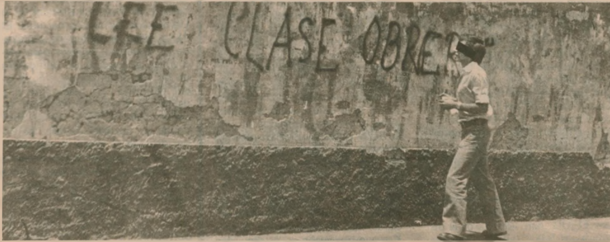
CLASE OBRERA, órgano central del Partido Comunista Revolucionario, también impulsó la lucha por la reapertura de las revistas.

LA MORDAZA DICTATORIAL CONTINUA. LOS SEMANARIOS CLAUSURADOS, ENTRE LOS QUE SE ENCUENTRA CLASE OBRERA, SIGUEN ACALLADOS. EL APRA, AL IGUAL QUE EL PPC, HAN AVALADO LA CONTINUIDAD DEL DESPOTISMO UNIFORMADO: LA ASAMBLEA CONSTITUYENTE EN SU ULTIMA SESION PLENARIA RECHAZO LA MOCION DE LA IZQUIERDA REVOLUCIONARIA QUE PLANTEABA NO INICIAR EL DEBATE CONSTITUCIONAL MIENTRAS DURE EL CIERRE DE LA PRENSA INDEPENDIENTE.