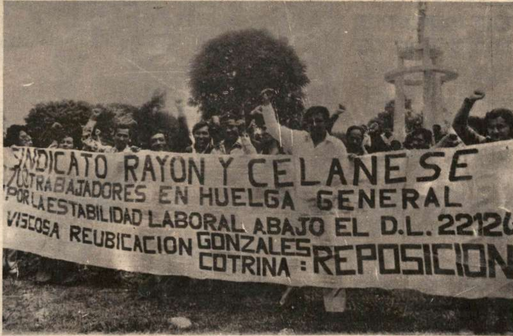
Los trabajadores de Rayon y Celanese vienen dando batalla para impedir que 136 compañeros sean despedidos por la patronal.