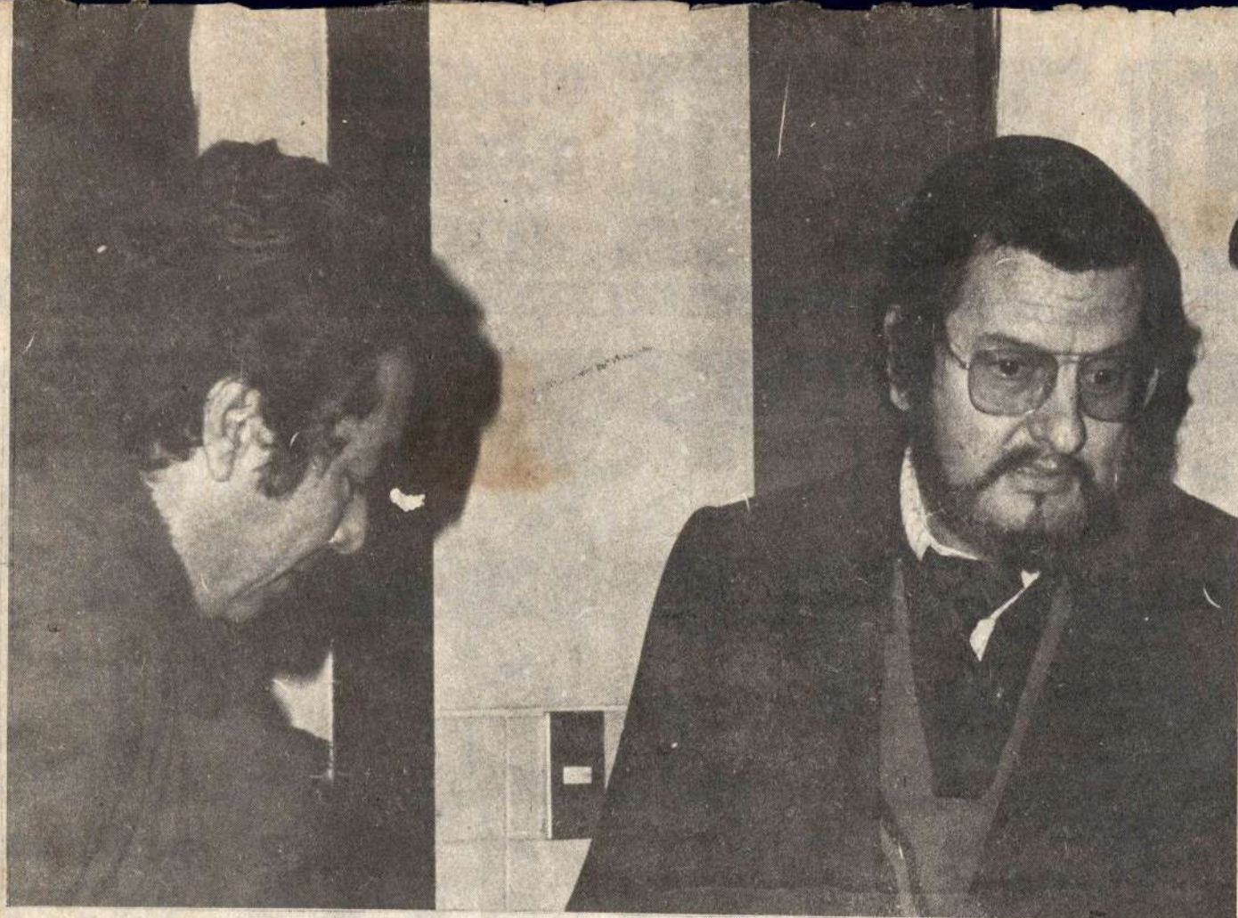
Herrera del PC(U) y Meza Cuadra del PSR(L): la "izquierda responsable" que busca un lugarcito bajo el ala de la burguesía.