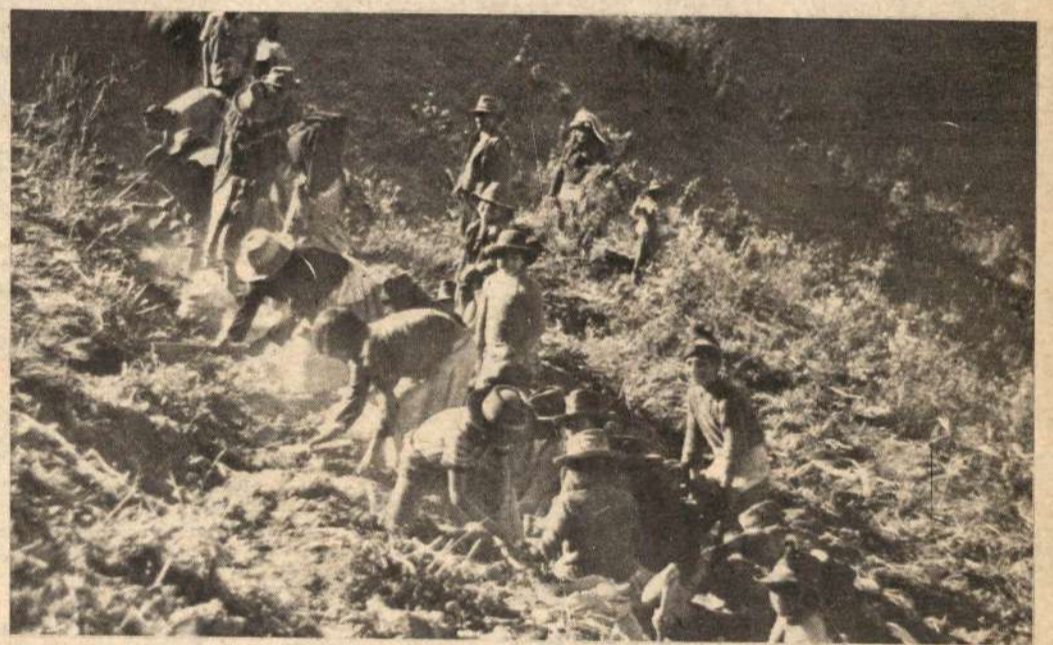
El gobierno en vez de combatir a los traficantes de cocaína, está reprimiendo al campesinado cocalero.

Ultimamente, la Federación Internacional de Trabajadores de la Construcción y Maderas, que representa a tres millones de trabajadores de 55 países del mundo, envió una carta a Morales Bermúdez en que le piden que examine las exigencias de los obreros y que tome acciones necesarias para evitar que se arriesgue la vida y la salud de los mismos.