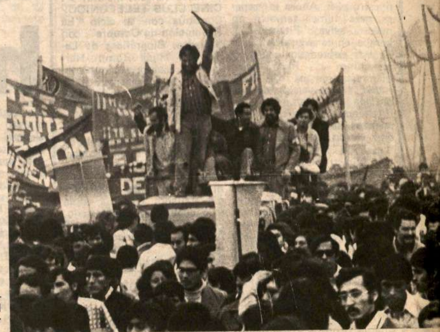
"Nosotros no podemos aceptar más al PC-U que al sector de Hugo Blanco".

La izquierda debe conquistar como consecuencia de este proceso, un mayor fortalecimiento de esa influencia que tiene ahora, influencia todavía relativa porque es un poco superficial, emocional, instintiva. Hay que convertirla en una influencia de tipo político.