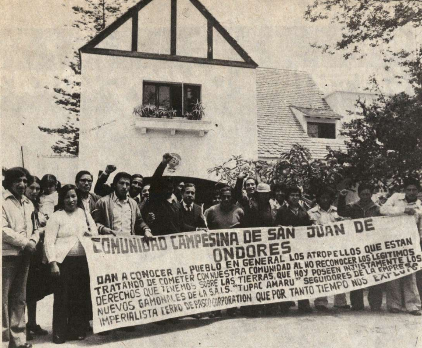
El Tribunal Agrario ha dado una ilegal marcha atrás cuando desconoce a la Comunidad de Ondores como legítima propietaria de Atocsaico.