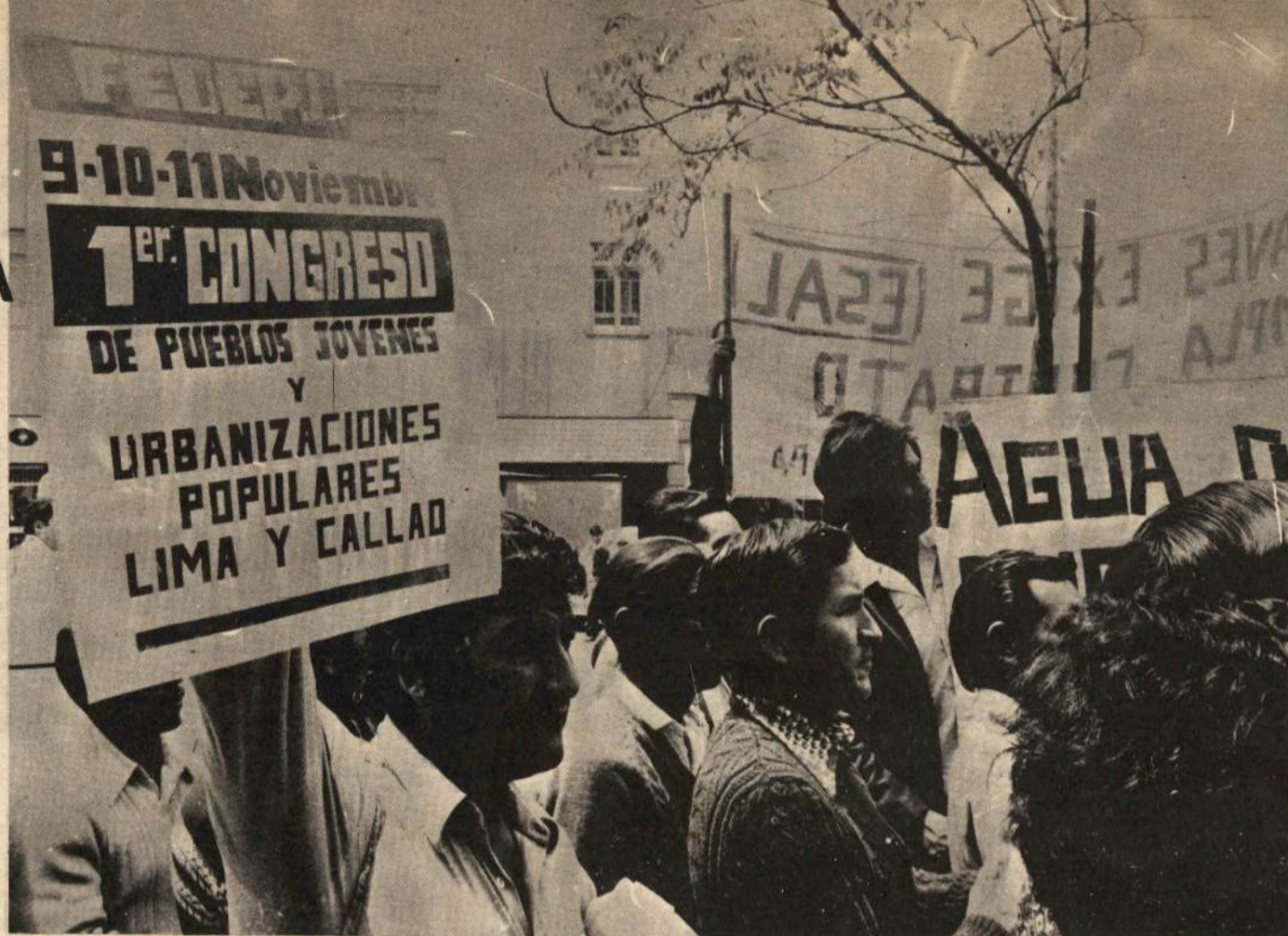
Más de mil pobladores barriales realizaron el martes 6 un mitin frente al local de Esal como parte de las movilizaciones previas al I Congreso de PP.JJ.

Este decreto tiene como objetivo fundamental la cuestión política: destruir y desconocer a las organizaciones gremiales de los PPJJ y a sus dirigentes; para abrir las puertas a los partidos reaccionarios de derecha; para que capten sus votos en este sector del pueblo que vota masivamente por la izquierda. Económicamente, este decreto busca incluirnos dentro del régimen tributario, trata que un poblador que no recibe ningún servicio del estado tenga las mismas obligaciones que un habitante de San Isidro; pagando, por ejemplo, licencia de construcción, declaración de fábrica, autoavalúo, canon de agua, impuestos de los que estábamos exonerados los PPJJ.