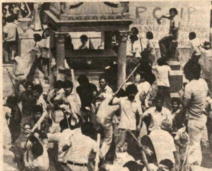
Abandonando criterios sectarios y contundentes palos.

A. ¿Es posible llegar a una alianza programática?