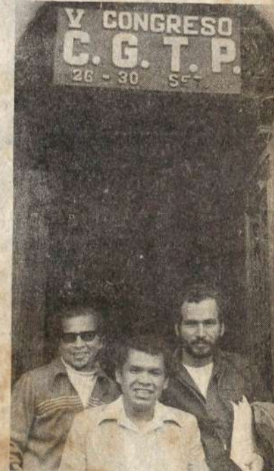
Dirigentes clasistas exigieron paro nacional.

Esto sin descartar ni dejar de lado el combate por la unidad, incluso con los reformistas y vacilantes, en acciones concretas y en un frente electoral con libertad de agitación para sus miembros, frente que las masas reclaman y en el cual no hay que tener miedo a las tendencias erróneas. Será el pueblo el que diferenciará posiciones, el que separará la paja del grano.