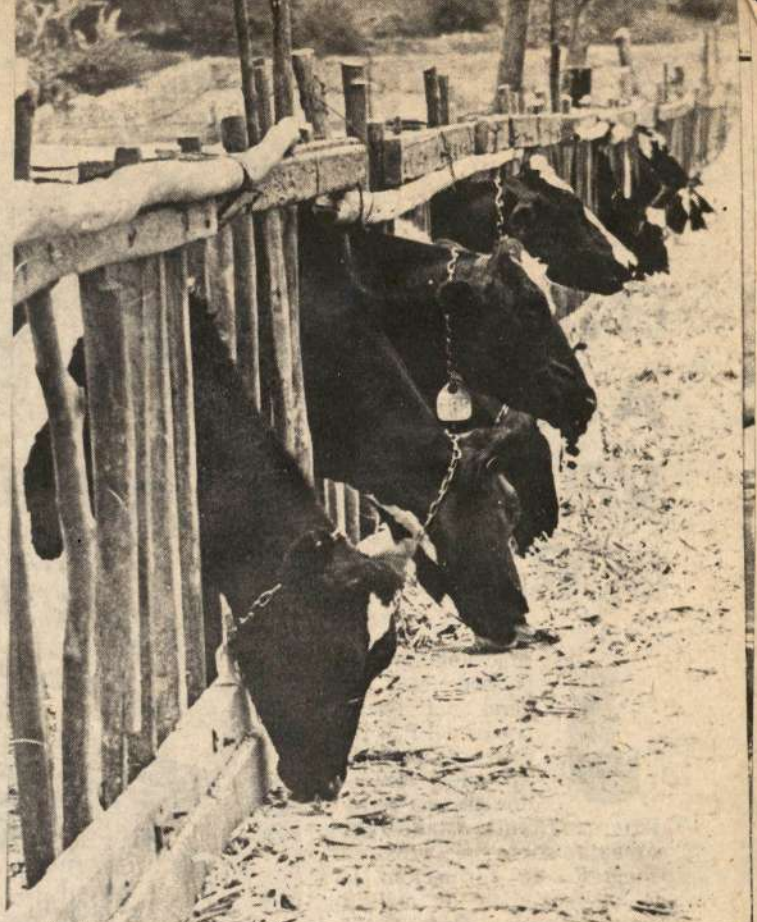
Los precios de la leche se han incrementado por segunda vez en un mes, mientras las transnacionales Carnation y Nestle siguen haciendo su agosto con el hambre de nuestro pueblo.