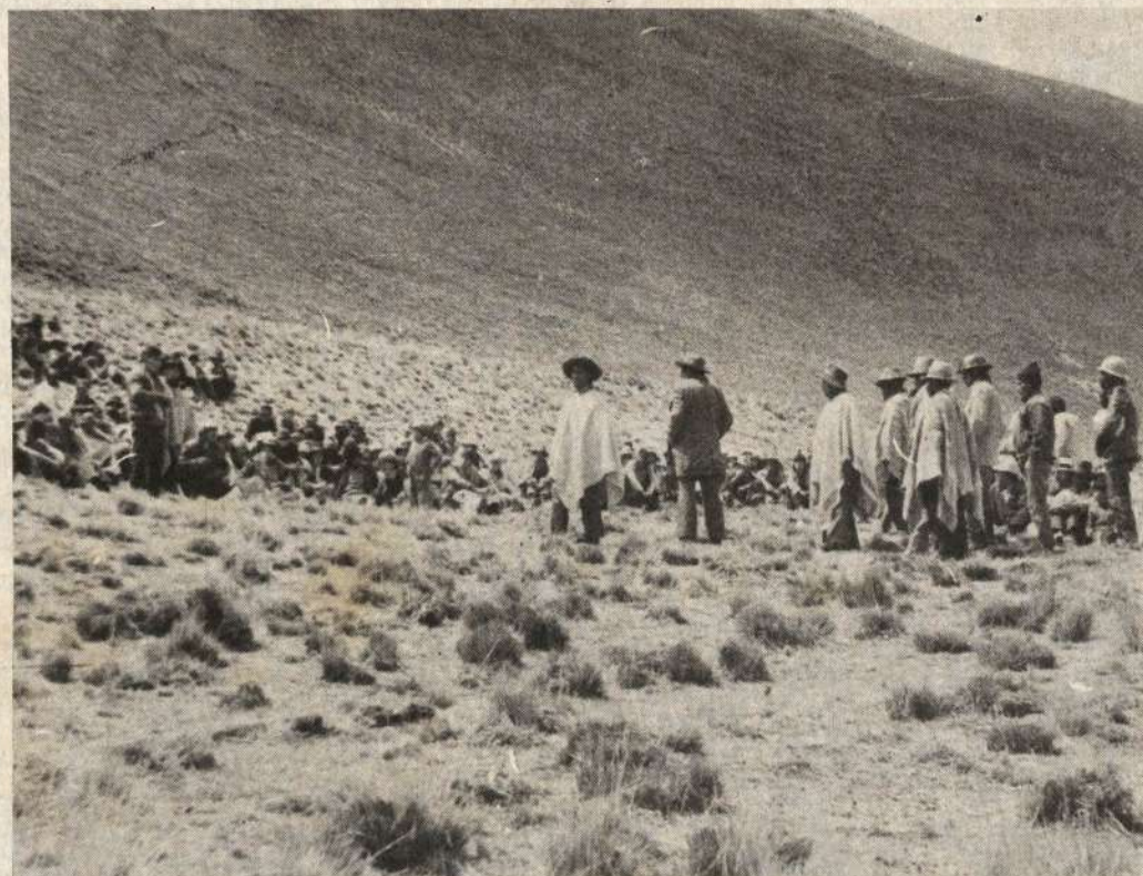
La SAIS Túpac Amaru pretende haber indemnizado a la comunidad de Ondores con 2 millones de soles por el predio Atocsaico, cuando éste fue evaluado en 18 millones.

Es una burla, sin embargo, que un Juzgado provincial pase a dictaminar que la sentencia del Tribunal Agrario, máximo organismo del fuero agrario, sea archivada y no se ejecute. Sobre los 2 millones de soles recibidos por la co-