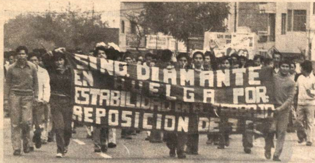
Una semana de huelga vienen cumpliendo los trabajadores de Diamante exigiendo la reposición de 7 dirigentes.

a pesar de la violencia represión policial, continúa exitosamente la huelga de los trabajadores de la fábrica El Diamante iniciada el 31 de octubre pasado en demanda de la reposición de varios dirigentes sindicales despedidos. Un escolar fue herido de bala por la guardia civil (USE) que