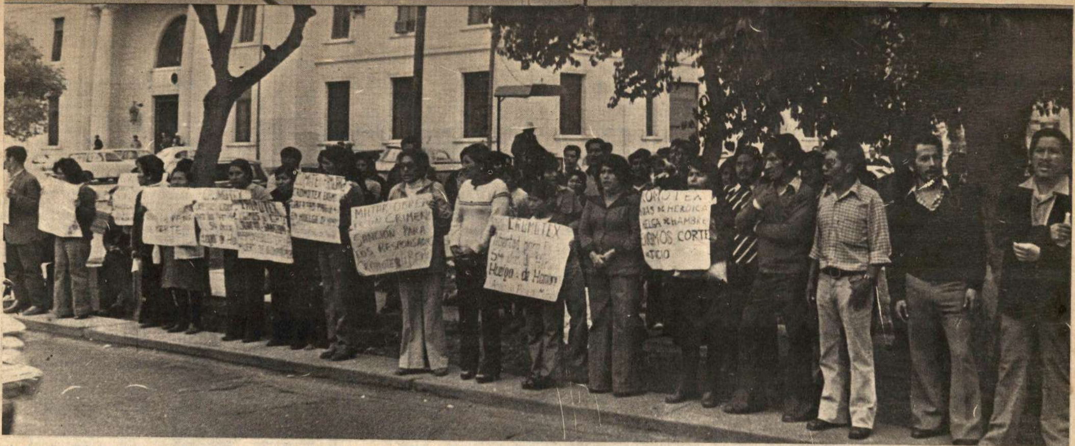
Los familiares de los obreros de Cromotex ante el Consejo de Justicia Militar. Ahora se les acusa de "atentar contra el cuerpo y la salud".