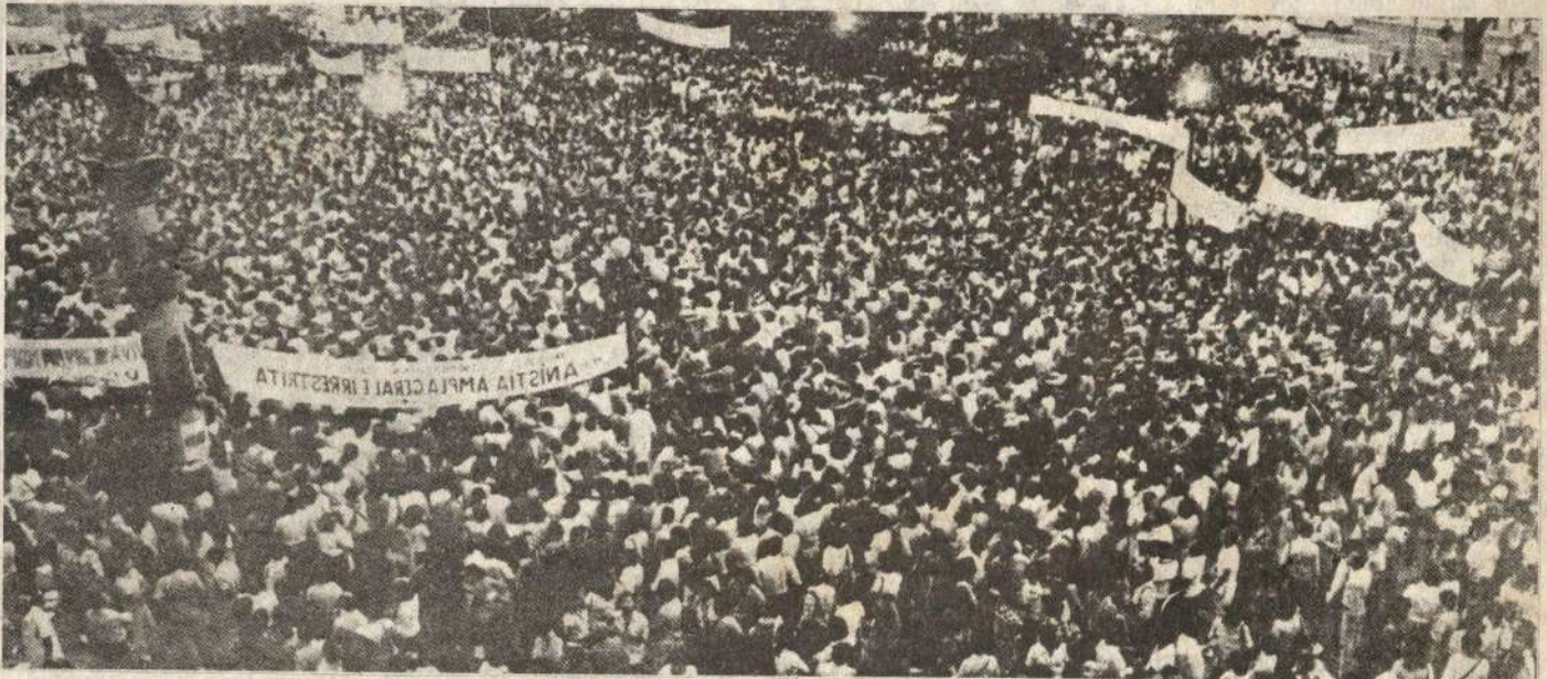
Manifestación en Río de Janeiro exigiendo una amnistía política irrestricta.

Paralelamente un cambio de la situación geopolítica de América en América Latina, hace necesario un reacomodo del Brasil, a través de nuevas alianzas básicamente con el eje del Pacto Andino, a través de Venezuela y Perú. Por tal razón seguramente se reunirán el 15 de octubre Morales Bermúdez y Figuei-