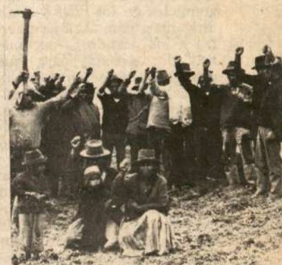
El gobierno pretende implantar una solución anticampesina en Anta.

En Atocsaico mientras tanto, los comuneros de Ondores, con la amenaza de desalojo policial y sus dirigentes perseguidos, redoblan las guardias campesinas dispuestas a defender sus tierras recuperadas.