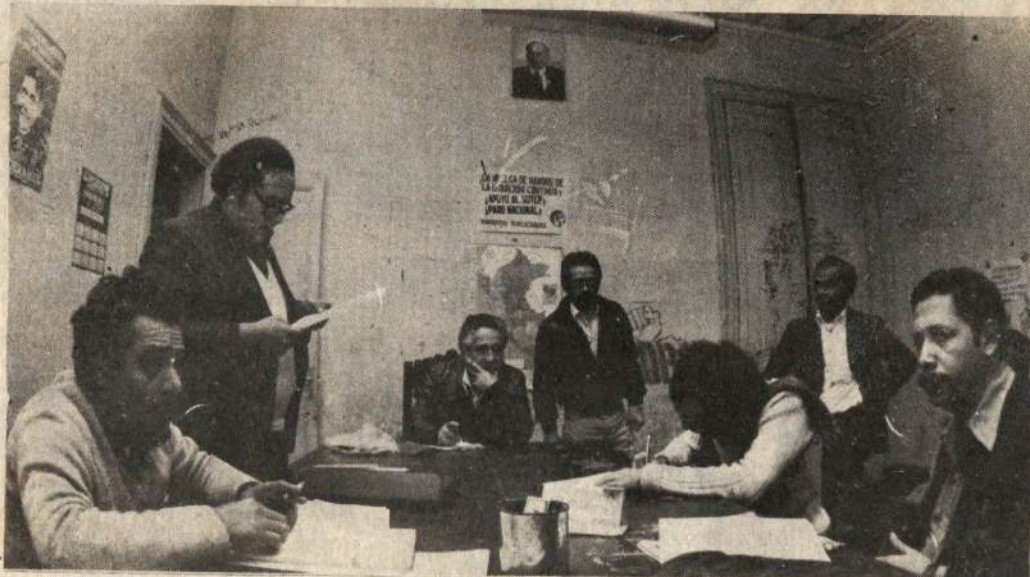
Es preciso que la izquierda revolucionaria constituya un sólido bloque y lance un pre-candidato.