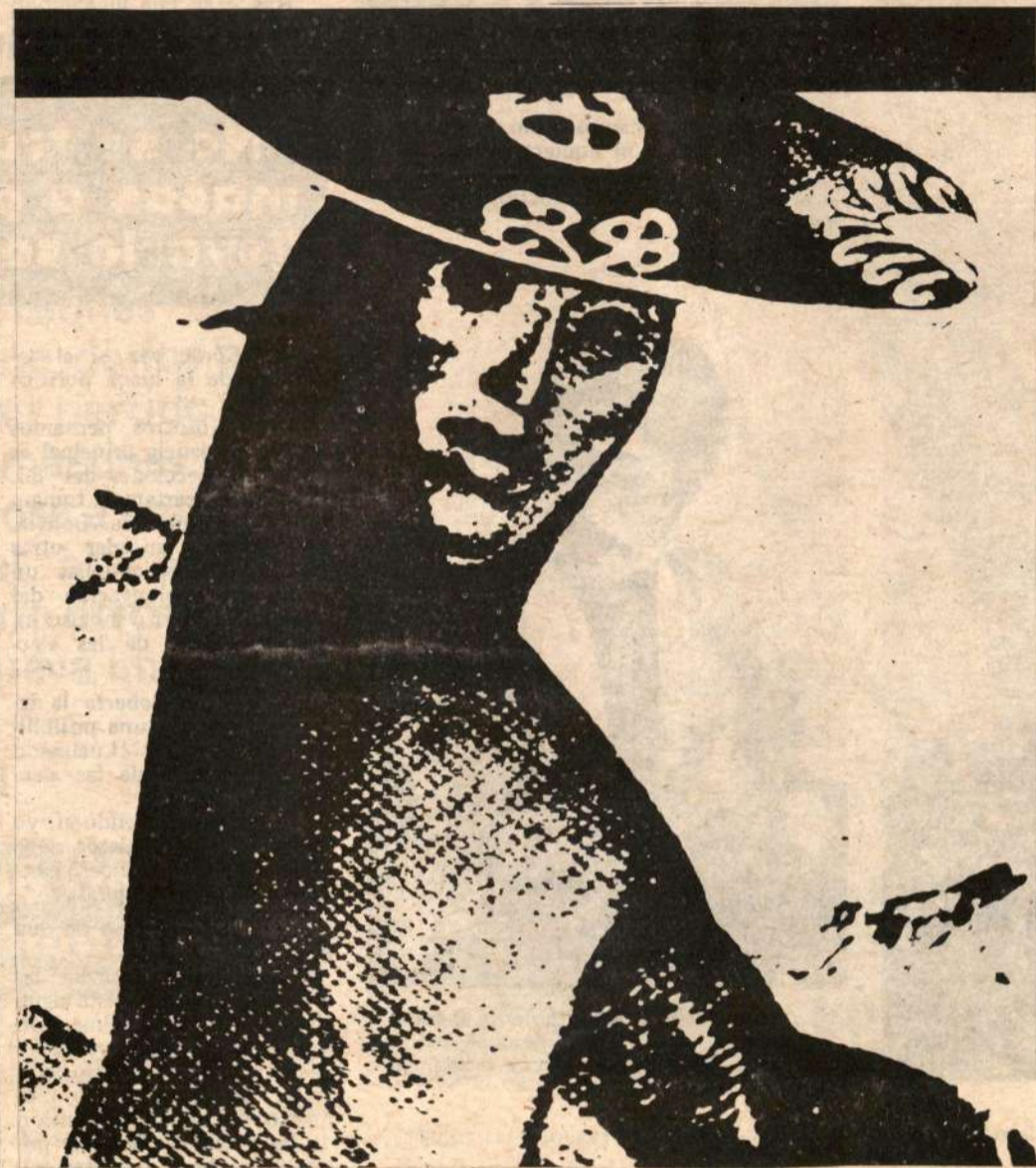
La Escuela de Bellas Artes que fundaron Daniel Hernández y José Sabogal (del cual admiramos un grabado) padece un terrible abandono por parte de las instituciones oficiales.

La Escuela de Bellas Artes de Lima y las Escuelas de Bellas Artes de todo el Perú son las cenicientas de la educación en el país. Poco a poco han ido perdiendo importancia, pues de tener categoría universitaria hasta 1970 aproximadamente, han pasado a ser simples dependencias del Instituto Nacional de Cultura. En el tránsito han ido perdiendo calidad académica y