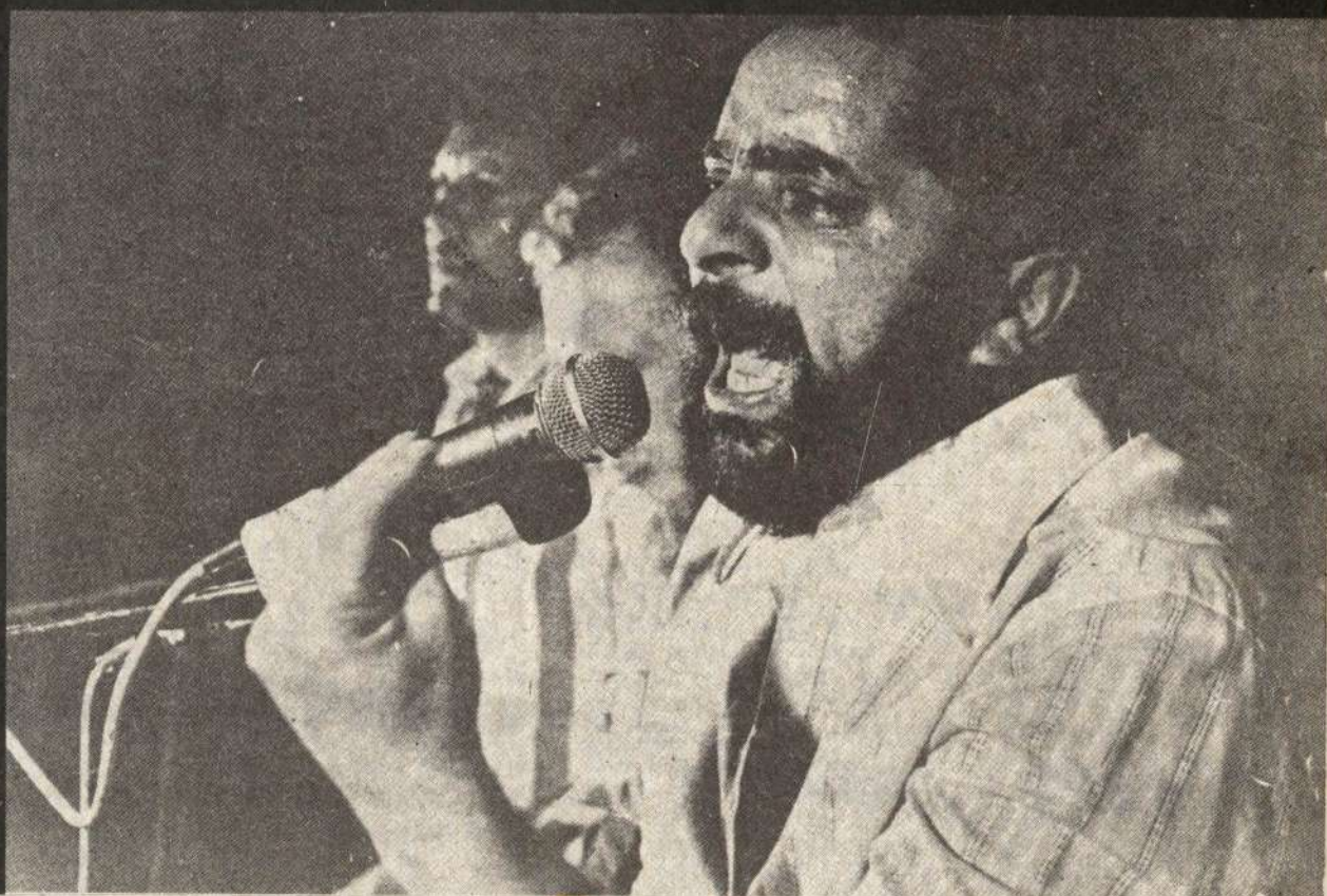
El dirigente metalúrgico Lula, hablando en un reciente mitin.