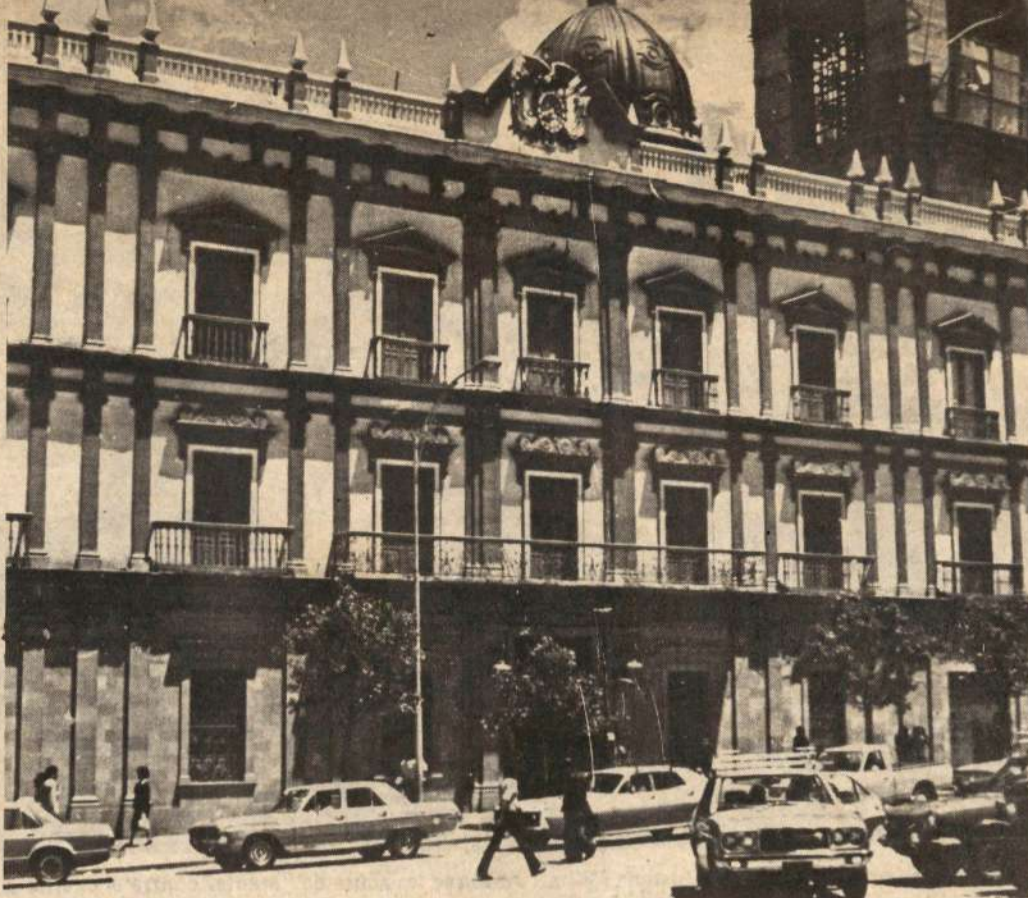
El Palacio Quemado de la Paz, donde se atrincheró el golpista coronel Natusch Busch.