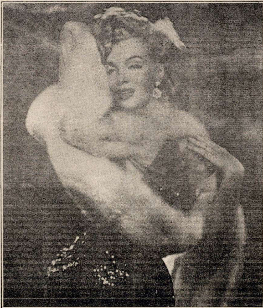
Marilyn en 1962.