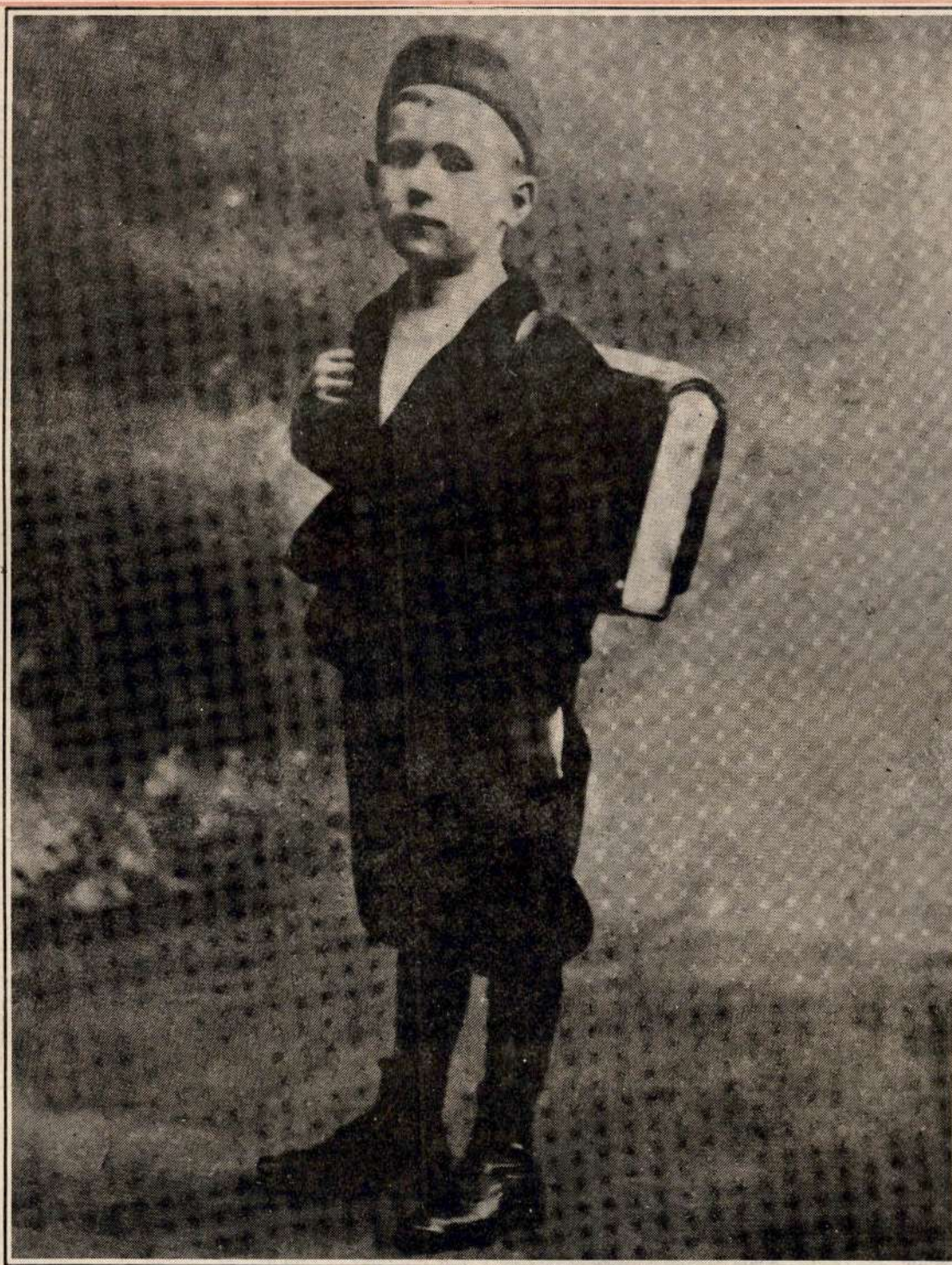
El infante Bertolt Brecht.

Aunque las primeras poesías de Brecht, escritas entre 1917 y 1927, son impensables si no tenemos en cuenta ciertos modelos expresionistas, son de una violenta y arrolladora originalidad; pero, ¿qué le importaba a él la originalidad? "Muchos opinaban que los grandes maestros de la música y de la pintura debían de haberse sentido orgullosos de poder hacer lo que