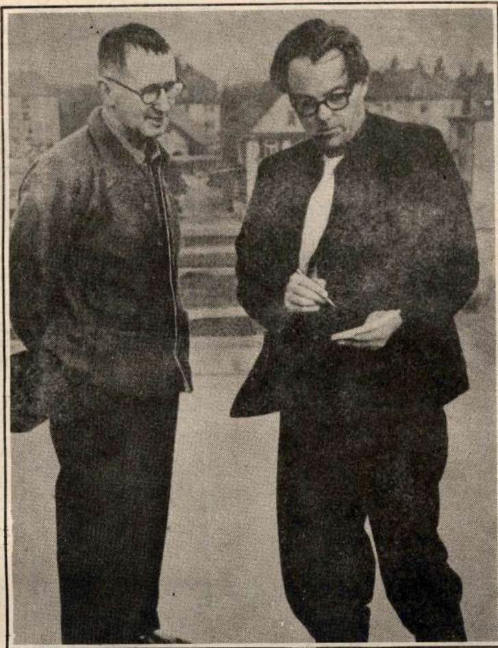
Brecht (izquierda) con el dramaturgo Max Frisch en 1949.

rios del teatro habían desarrollado en cuanto a técnicas y procedimientos de halago y revulsión. La escandalosa moral libertina de un enfant terrible literario se hizo canción, o mejor song , una canción de melodía pegadiza y ritmo trepidante a la que nadie podía resistir. Al asociarse a Kurt Weill, y, en definitiva, al asociarse a la música que desde entonces ya no abandonó, Brecht consideró un aumento considerable de fuerza expresiva y de mímica, y ensanchó la base de su público más allá de la platea literaria, hasta las calles y las salas de baile. El texto es chispeante y la música es irónica y sentimental, graciosa y excitante, próxima al jazz, pero extraordinariamente melódica, destinada a sobrevivir la oscuridad de los tiempos, repetida anónimamente por las calles de todas las ciudades de los dos hemisferios. Quien la oyó una vez, no la olvida, en cualquier idioma a los que ha sido traducida: "Señores que pretenden enseñarnos/ tratando de cambiar/ nuestro instinto criminal/ primero traten de alimentarnos/ comer primero/ luego la moral". (1). La obra lo era todo menos una pieza de propaganda. Concebida como una ópera épica tenía que hacer frente a los intentos de hipnotización de la antigua ópera dramática o "todo cuando debe producir entusiasmos indignos". Sin embargo, esa historia de gangsters y prostitutas entusiasmó a la platea hasta el paroxismo. Según Brecht,