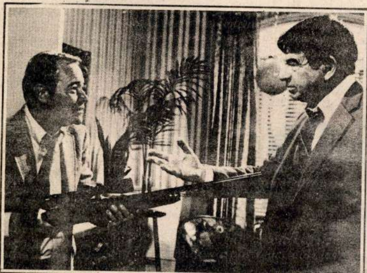
Jack Lemmon y Walter Matthau en la reidera película "Compadres", de Billy Wilder.