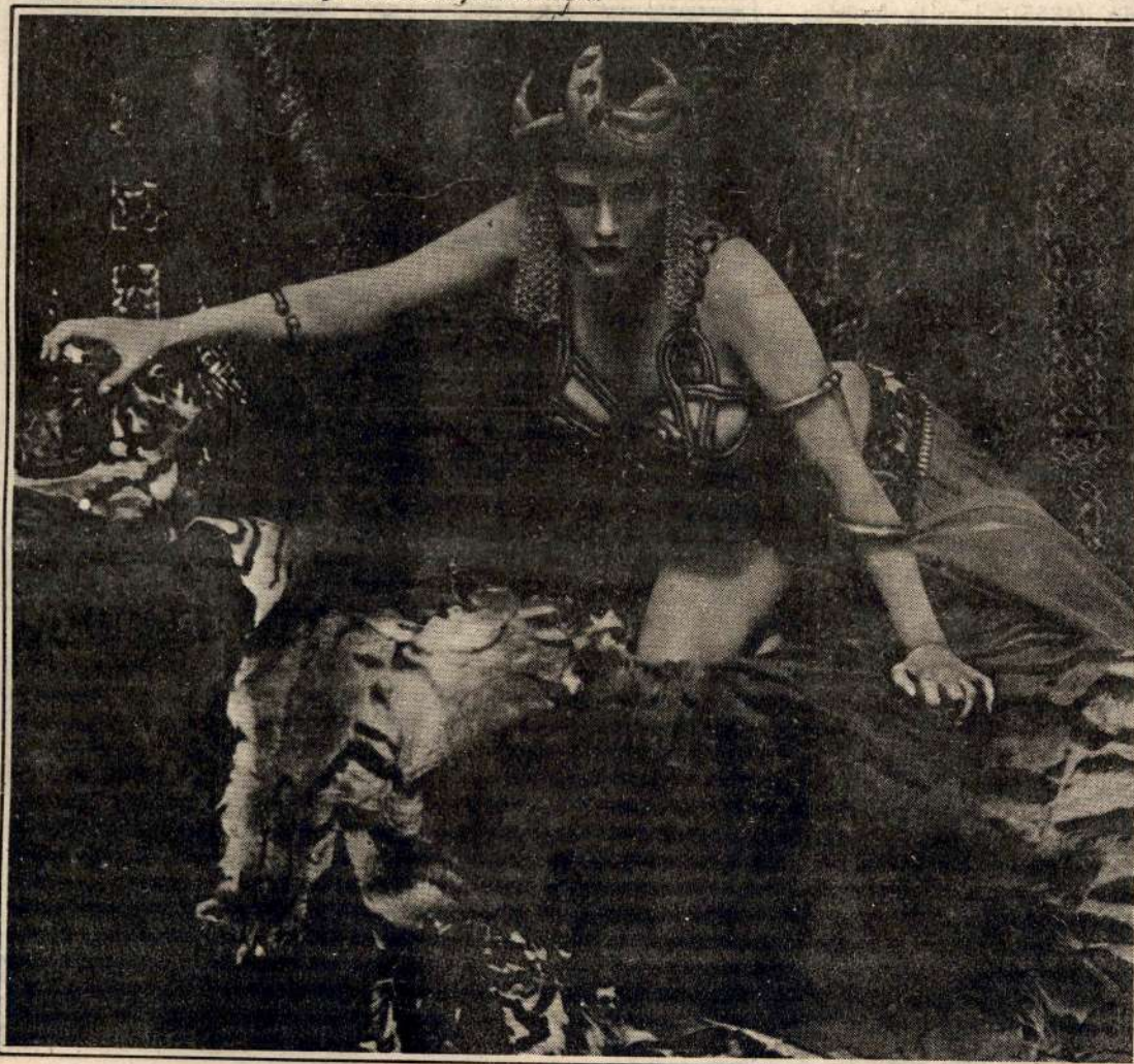
Marilyn parodiando a la vampiresa silente, Theda Bara.

Ni Pola Negri ni Jean Harlow ni Carole Lombard, entre las mujeres, ni Rodolfo Valentino (ejemplar arqueológico de sarcófago egipcio, "chulpa" andina o tumba etrusca) ni Humphrey Bogart ni James Dean, entre los hombres (?), se le pueden parangonar. Ella, Marilyn, los supera a todos y a todos los resume. Y no olvido que Marilyn Monroe fue una de las rarísimas estrellas cinematográficas cuya muerte fue anunciada en destacadísimo lugar (para el severo sistema jerárquico del Kremlin) por la prensa soviética. Fuera de Jean Seberg y Natalie Wood —de ascendencia rusa— no sé de ninguna otra. Pero no podría asegurar categóricamente que los ojalá lejanos decesos de Sandra Dee, Kim Novak, Kirk Douglas, Peter Ustinov o Gene Wilder —también de estirpe rusa— vayan a merecer en lo futuro el honor de una