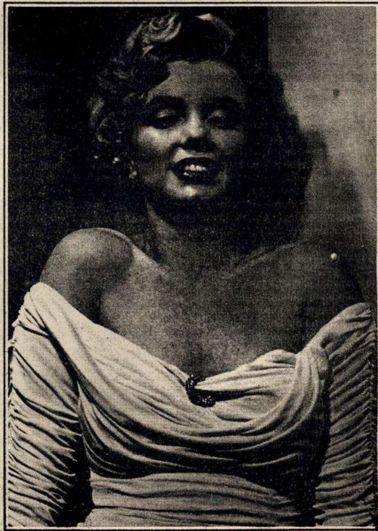
Marilyn en 1952.

(2) El subrayado es mío. (3) En 1980 la revista sueca "Fib Aktuell" reveló que una cinta asquerosamente pornográfica, de 1948, y hartamente deteriorada, probaba paladinamente la participación protagónica de M.M. en dicha cinta. Se descubrió en los archivos de un fotógrafo que trabajaba en la floreciente industria pornográfica de los Países Bajos y nórdicos. El lúgubre "Penthouse", ¡cuándo no!, lo lanzó a los cuatro vientos. La prensa mundial prestó oído jubiloso, hizo eco retumbante, propio del Valle de los Muertos, a la salaz noticia. Pero un más acucioso análisis de la antigua, amarillenta, gastada y borrosa película permite a los amigos de Marilyn albergar las más serias y justificables dudas sobre si la protagonista "es" efectivamente Marilyn, y no una mujer muy parecida a ella, o, en última instancia, sospechar de si no se trata de una siniestra broma armada de pies a cabeza con los modernos medios (y métodos) de tergiversación electrónica, ¡y con arteros designios comerciales, naturalmente! Yo, por lo pronto, niego la autenticidad de los rollos exhumados. ¡No es Marilyn! ¡Existe inconmensurable diferencia entre posar artísticamente desnuda para un almanaque (que en sus tiempos casi arruina la carrera de la actriz) y prestarse para ser la inmundicia, vergonzante y huidiza protagonista de una cinta hard (dura) pornográfica! Marilyn no se hubiera atrevido a tanto. Todo no pasó de ser un brulote fallido y de pésimo gusto.