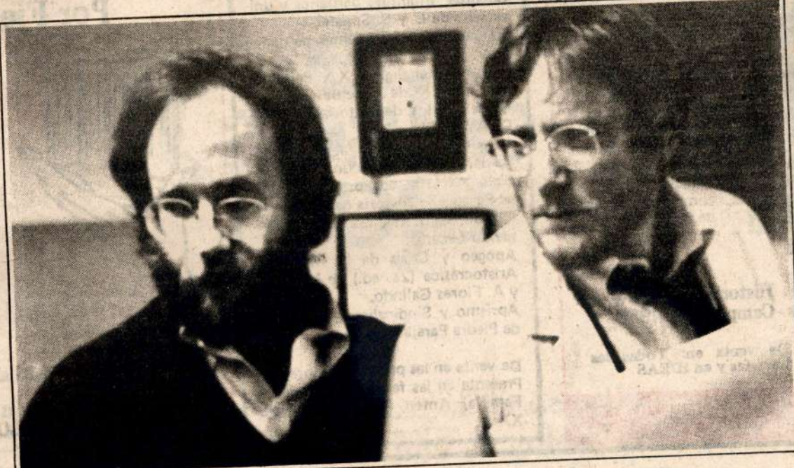
"Estados alterados", truculento filme de Ken Russell.

Estados alterados es demasiado pretenciosa para poder tranquilamente constituirse en una buena película de entretenimiento