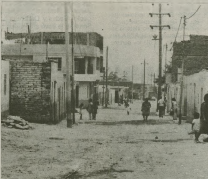
El aumento del 30 % en los alquileres es otro rudo golpe a la economía popular, IDEBEMOS OPOERNOS A ESTA MEDIDA REACTIVANDO LAS ORGANIZACIONES POPULARES VECINALES, BARRIALES, DE INQUILINOSI.

La vivienda no puede seguir siendo algo a lo cual sólo los ricos pueden tener derecho. Por ello planteamos impulsar la construcción de viviendas populares, construyendo grandes complejos habitacionales de propiedad colectiva, y no las grandes "residencias" destinadas a los millonarios explotadores; hay que convertir el alquiler en contrato de compra de todas las propiedades de vivienda mediana y pequeñas, expropiando a los casa-teratenientes urbanos que se enriquecen a costa del pueblo, y estableciendo la fijación de un alquiler regulado proporcionalmente al salario real; además, se debe contar con servicios gratuitos por parte del Estado cuando se refiere a la construcción y agrupación colectiva de la población en la construcción de viviendas propias.