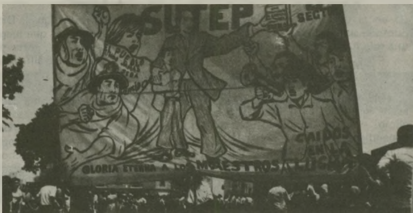
Ni los asesinatos a dirigentes, ni las cárceles, ni las amenazas, harán retroceder al SUTEP en la preparación de su Huelga General.

Esto tiene que ver mucho con la campaña electoral del APRA, que seguramente tendrá mucho de danza pero poco de calidad.