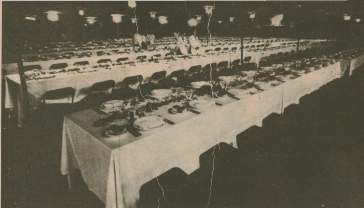
Una cara de la medalla: la opulencia de unos pocos...

Frente a la situación antes descrita, aproximadamente 4,500 Comunidades Campesinas con el 25 % de la población nacional y el