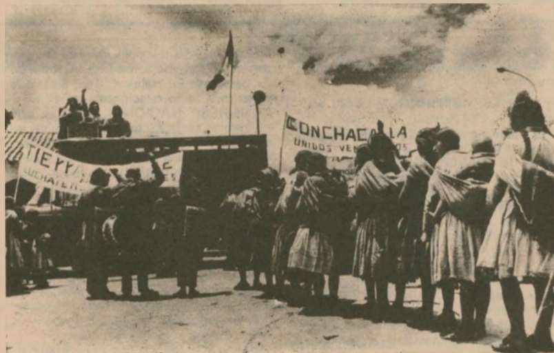
La política económica de la dictadura favorece el imperialismo y a las clases dominantes del país, sembrando hambre, miseria y muerte entre las masas populares.

4.4 Anulación del control del FMI sobre la economía del país.