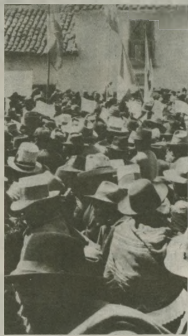
Hoy día el movimiento campesino se ha convertido en el terror de la dictadura y la reacción y aunque desaten mil furias represivas contra él, jamás podrán doblegarlo, ¡VIVA LA ALIANZA OBRERO CAMPESINA!

La mejor manera de frenar y desbaratar esta ofensiva represiva es luchando. Por eso el PCR considera fundamental continuar con las tomas de tierras, elevar su contenido fortaleciendo la organización democrática del campesinado, vincularlas con las acciones urbanas, avanzar en la forja de los Frentes de Defensa basados en la alianza obrero-campesinas, forjar los Comandos de Auto-Defensas, y afianzar los gremios clasistas, haciendo que el CEN-CCP asuma efectivamente su rol como dirección nacional del campesinado. Esta será la mejor manera de hacerle frente a la campaña insidiosa de Opinión Libre y demás fuerzas despóticas y opresoras.