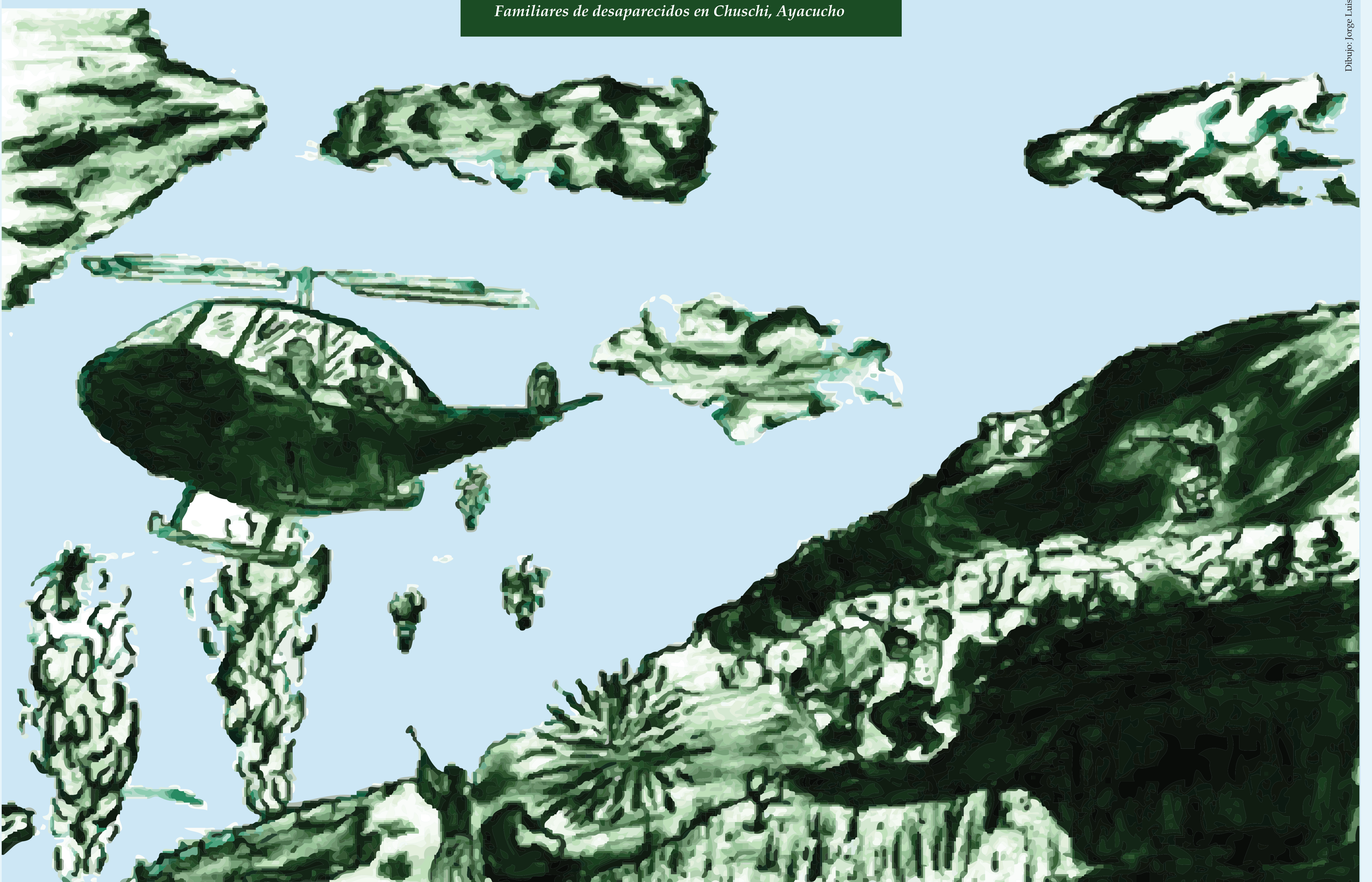
Dibujos: Jorge Luis Vera Lozano