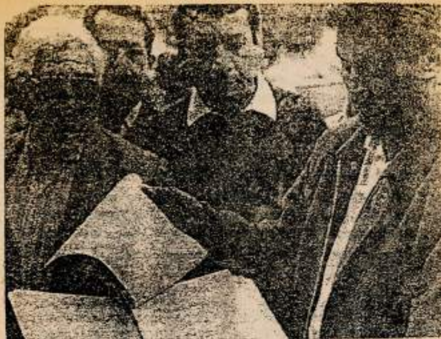
RETORNO AL ESTADO DE DERECHO