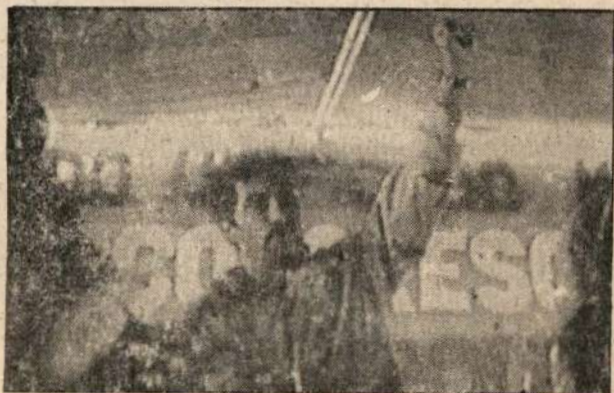
... la fructífera convivencia con hermanos comunistas extranjeros, principalmente latinoamericanos.