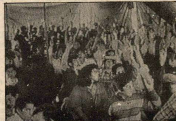
Tras un debate nacional y democrático el Congreso aprobó bases de unidad ideológicas, programáticas y estratégicas.