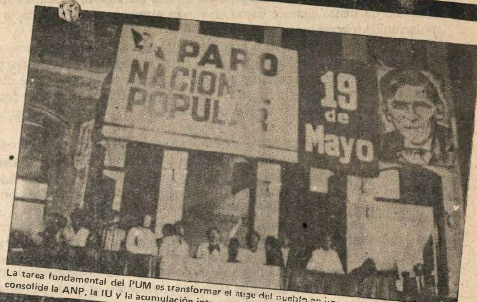
La tarea fundamental del PUM es transformar el auge del pueblo en un auge revolucionario que consolide la ANP, la IU y la acumulación integral de fuerzas.

Se ha desarrollado un vigoroso sindicalismo clasista que socava los planes gran burgueses. Hay significativos avances de la organización y movilización centralizada del campesinado y los productores agrarios que agudizan la fisura del viejo Estado. Se desarrolla un creciente movimiento descentralista que encara al Estado centralista incorporando a la lucha a nuevas regiones. Los movimientos de los pobres de la ciudad y el campo avan-