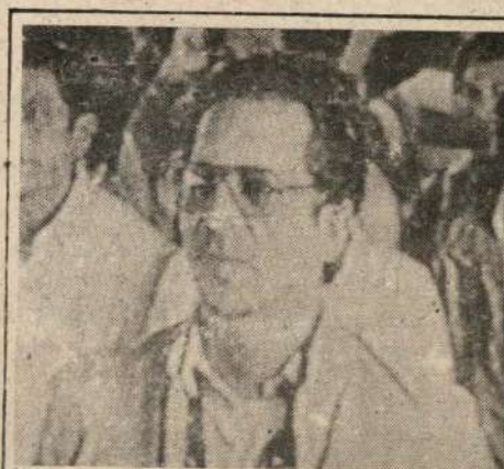
El c. [redacted] Secretario General