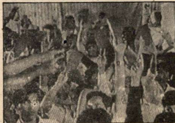
La trascendencia del evento se conjugó con la alegría, el espíritu unitario y la disposición-combativa de las delegaciones.