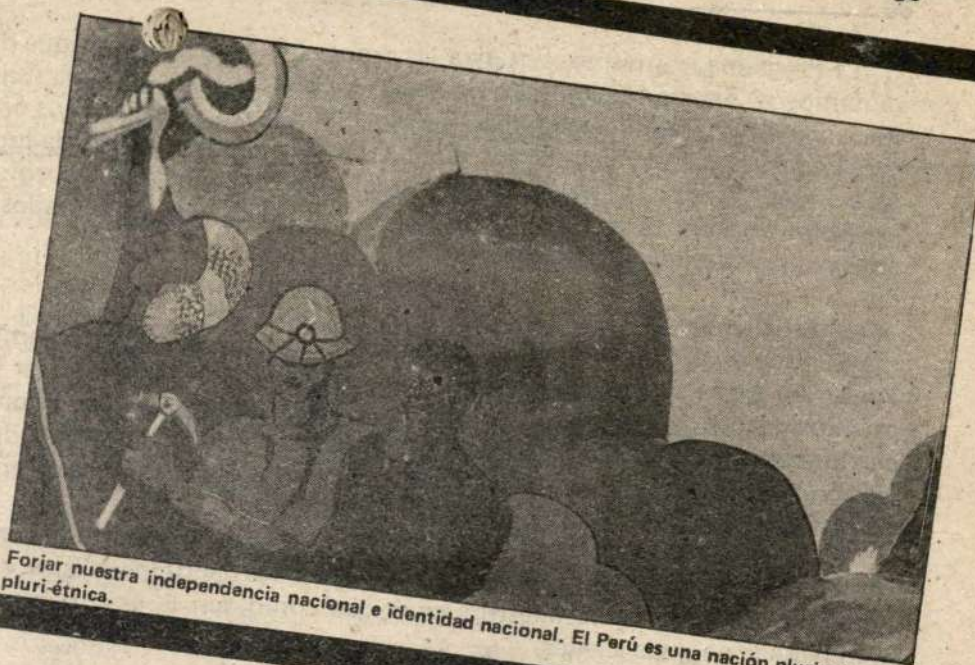
Forjar nuestra independencia nacional e identidad nacional. El Perú es una nación pluricultural, pluri-étnica.

3. Incorporando un conjunto de observaciones, añadidos y enmiendas puntuales que han sido recogidas, aprobar el documento presentado por la Comisión de Programa del CC, "El Programa de los Mariateguistas para Forjar la Nación y construir el Socialismo".