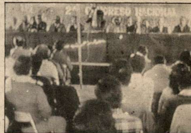
Nuestro Congreso eligió su Mesa Directiva.