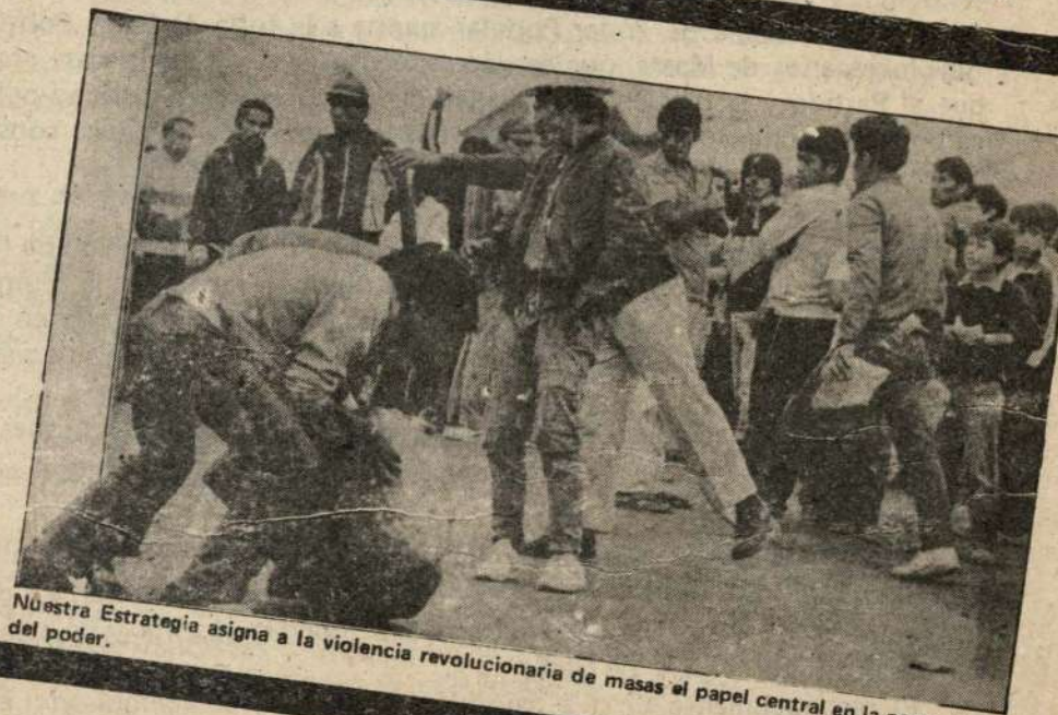
Nuestra Estrategia asigna a la violencia revolucionaria de masas el papel central en la conquista del poder.