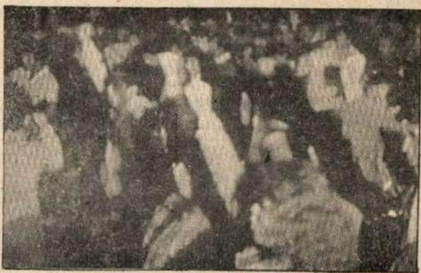
... el compromiso revolucionario de llevar a la práctica los acuerdos del Congreso.