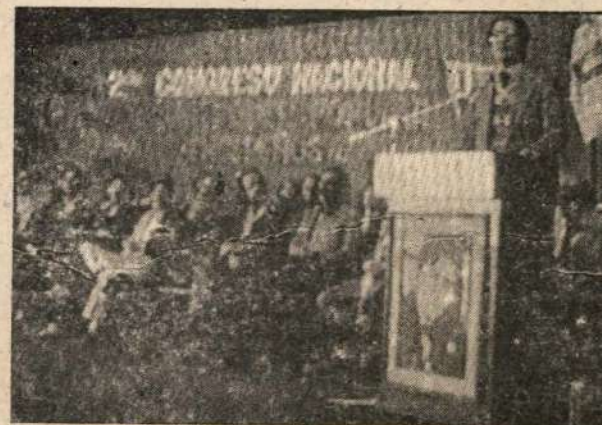
El c. [redacted], Secretario General, se dirige a los participantes del Acto Público de Clausura de nuestra II Congreso.