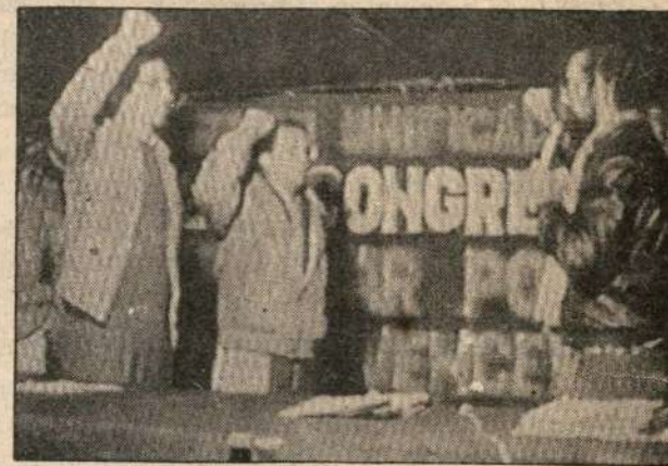
Juramentación de los cc. Secretario General y Sub Secretario General respectivamente, que eligió nuestro Congreso.