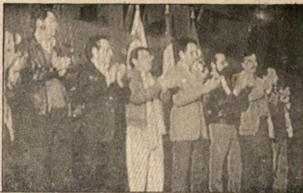
...la voluntad unitaria en la elección de la Dirección Nacional.