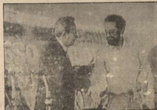
Saludos del c. Faure Chamón, del PC de Cuba, a nombre de las delegaciones extranjeras hermanas.