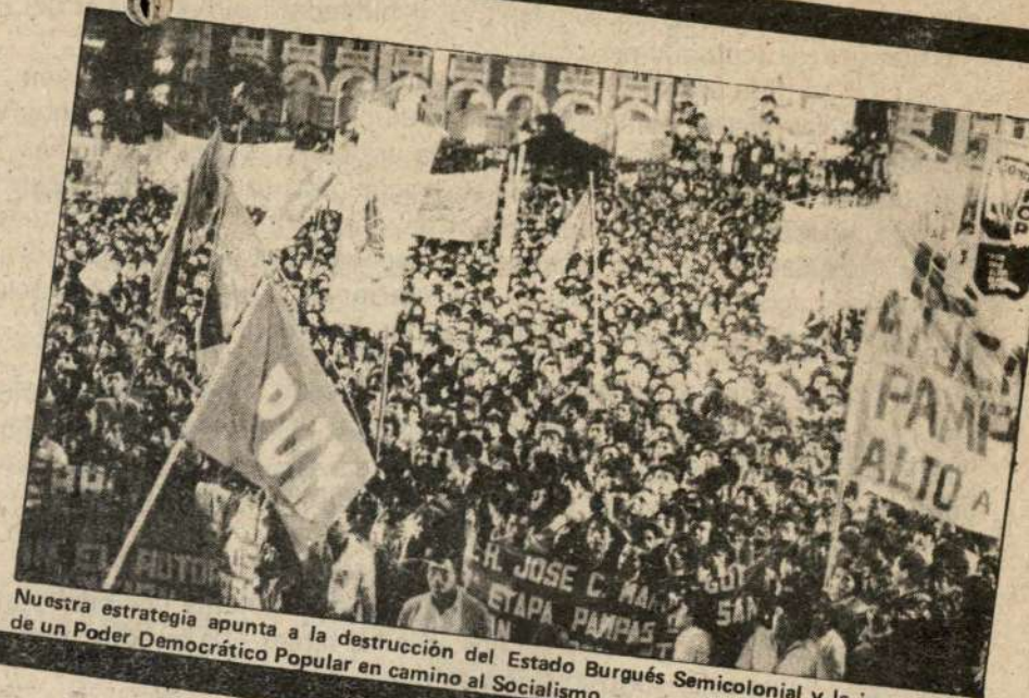
Nuestra estrategia apunta a la destrucción del Estado Burgués Semicolonial y la instauración de un Poder Democrático Popular en camino al Socialismo.

6. El Estado Burgués actual es un instrumento de dominación semico-