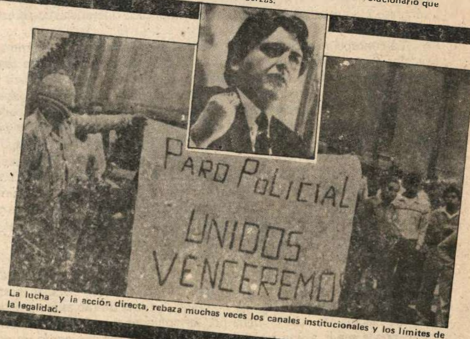
La lucha y la acción directa, rebaza muchas veces los canales institucionales y los límites de la legalidad.