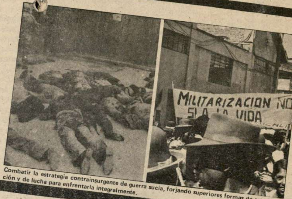
Combatir la estrategia contrainsurgente de guerra sucia, forjando superiores formas de organización y de lucha para enfrentarla integralmente.

2. Que la propuesta táctico-estratégica que aprobemos en el II Congreso, debe desarrollar y enriquecer la propuesta fundacional incorporando los diversos aportes que en el curso de estos tres años se han desarrollado. Estos elementos han sido analizados en el Informe Político del Secretario Ge-