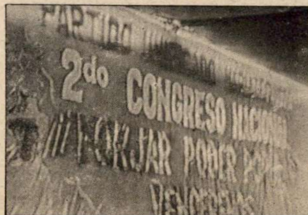
"Crear, Forjar, Conquistar Poder Popular" fue el nombre de nuestro Congreso.