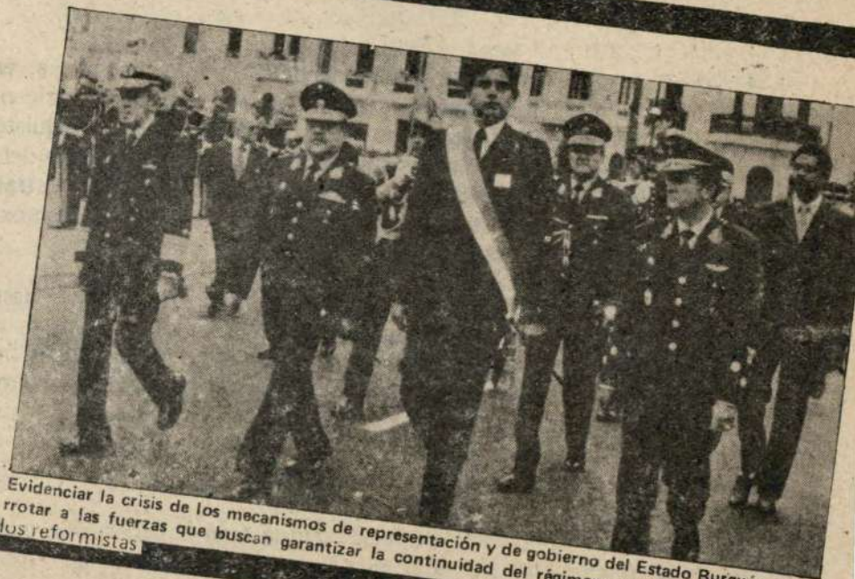
Evidenciar la crisis de los mecanismos de representación y de gobierno del Estado Burgués. Derrotar a las fuerzas que buscan garantizar la continuidad del régimen: APRA, FREDEMO y los reformistas