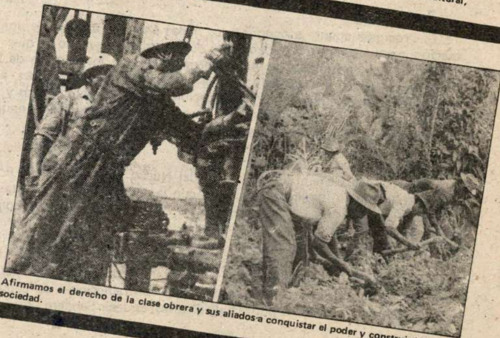
Afirmamos el derecho de la clase obrera y sus aliados a conquistar el poder y construir la nueva sociedad.