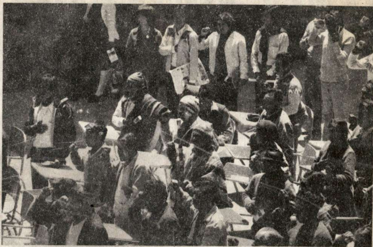
Encuentro de Quechuas, Aymaras y Amazonenses: gran paso en la Unidad de las Nacionalidades.

I CONGRESO DEPARTAMENTAL DE PUEBLOS JOVENES Y URBANIZACIONES POPULARES DE LIMA Y CALLAO: 9-1011 DE NOVIEMBRE. INAUGURACION: Viernes 9, 5 p.m., en el Local Comunal del Pueblo Joven "El Ermitaño" (Segundo Sector). Av. Los Jazmines 215 (Km. 4.5, Av. Túpac Amaru).