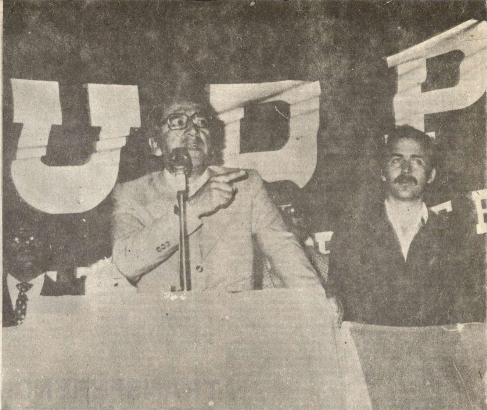
Dr. Alfonso Barrantes Lingán: Candidato Unitario de la Izquierda a la Presidencia de la República, hablando ante miles de piuranos que coreaban: "Barrantes UDP, el Pueblo tiene Fé". A su costado Manuel Dammert del PCR.