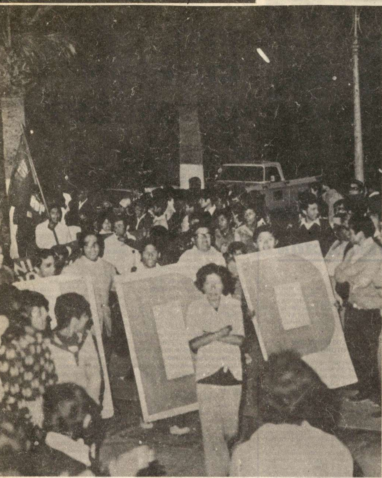
El nutrido destacamento de la UDP aparece marchando rumbo al lugar donde se realizara el masivo mitin udepista en Talara, allí el c. Alfonso Barrantes fue ratificado como el Candidato Unitario de la Izquierda para el 80.