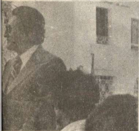
Ni la Dictadura Militar, ni los matones apristas pudieron impedir que la UDP ganara las calles en el Norte: ALFONSO BARRANTES, Candidato Unitario de la Izquierda en el Mitin de Ayabaca, Piura.

fuerzas de izquierda —en especial con el FOCEP— a os, es otro avance de suma importancia. Por ello, la masas, cuestión perfectamente visible no sólo con la presencia del c. Barrantes, sino también por la solidez UDP, entre quienes se encontraban los compañeros estro Partido, el Partido Comunista Revolucionario. zquierda, éste es el camino de las masas, muy dife- "Frente Unitario" con un raleado mitin en Surqui-