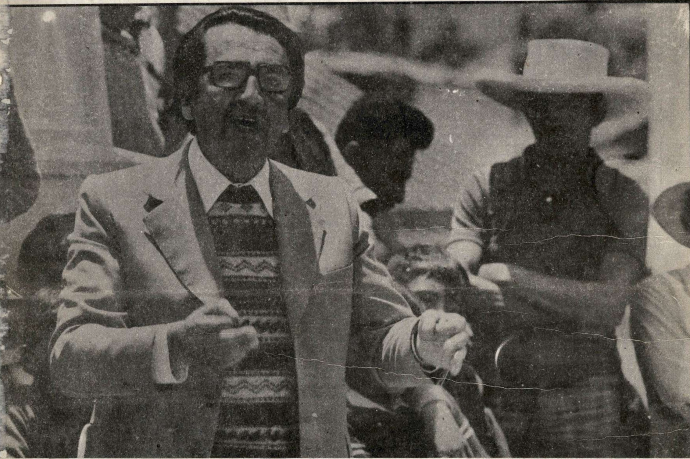
DR. ALFONSO BARRANTES LINGAN