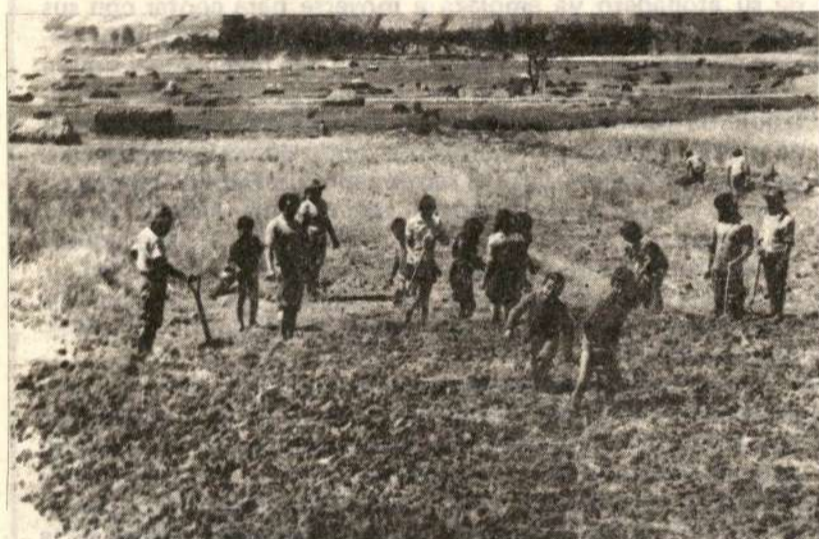
Debe desarrollarse una política agraria en función de las necesidades alimentarias del pueblo peruano.

A través de una campaña publicitaria por TV hizo su aparición una rara institución fantasma denominada "CLUB DE LA LECHE" integrado por señoras, astrólogos y el supernutrido ¡Sí, pueden! ¡Finalidad, quién sabe? Pero sabemos que el objetivo es contrarrestar las conclusiones hechas públicas en la Jornada Científica de Chaclacayo, en la que se definió el Perú como un país con más del 50 % de peruanos (más de ocho millones) que viven una situación de consumo deficitario de alimentos y con tendencias alarmantes en los últimos años, sobre todo para nuestra niñez. Quedó demostrado también que la leche artificial (Gloria, Nestlé, en polvo, etc.) son dañinos para la salud del niño y su desarrollo posterior, puesto que son productos comerciales que se venden como si fueran repuestos, licuadoras o ladrillos con criterio de mayor ganancia. A los monopolios no les interesa alimentar al pueblo; sólo les interesa lucrar con la salud del pueblo sometido; esta es la política alimentaria que gobierna al Perú. Si no vemos, la empresa transnacional Leche Gloria S.A. por exportar leche recibe un subsidio estatal del 17 % de Cértex, muy aparte de los millones de dólares de utilidades que arroja la empresa y sin que le importe si hay leche o no para los niños peruanos. Es decir, el Estado deja de percibir por este subsidio el equivalente a montos capaces de financiar la construcción de 10 escuelas mensuales o cien casas populares mensualmente. (continuará)