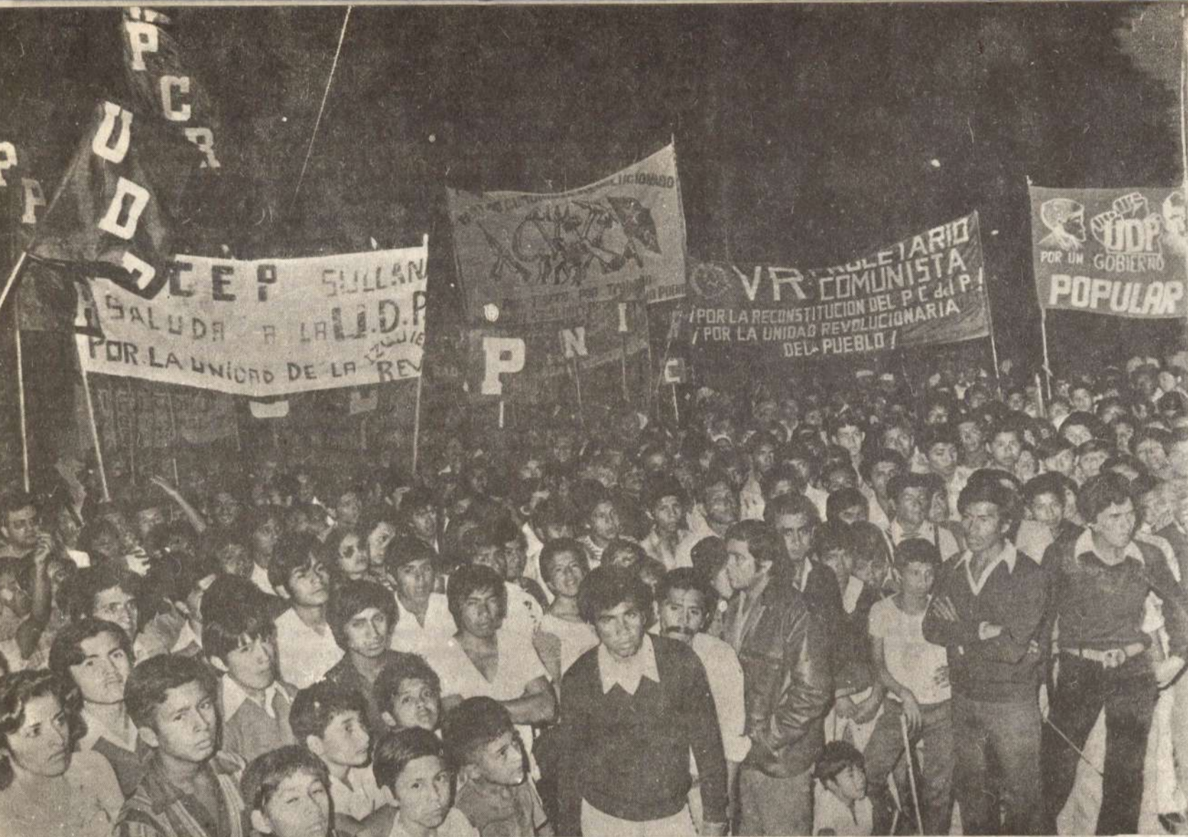
Sullana con la Izquierda Revolucionaria: masivo Mitin Popular del 28 de Setiembre convocado por la UDP.