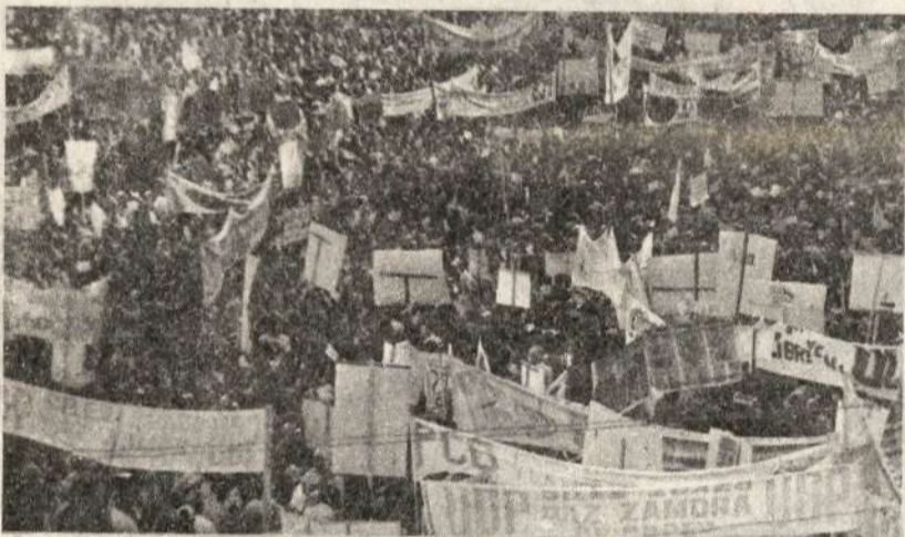
El pueblo boliviano resiste heroicamente a la dictadura de Natush.

EL PARTIDO COMUNISTA REVOLUCIONARIO, se aúna al rechazo tajante que el campesinado y pueblo boliviano en general, manifiestan contra el golpe militar y el espúreo gobierno constituido. Nadie, ni en Bolivia y en el mundo entero, está de acuerdo con la forma como un grupo de militares reaccionarios, pretenden resolver los problemas políticos en Bolivia. Nadie, excepto el imperialismo, por supuesto. Nos solidarizamos con el hoy cruelmente reprimido pueblo boliviano, demandamos el inmediato retiro de los militares del gobierno y llamamos a apoyar la heroica resistencia que las masas enfrentan contra la dictadura de Natush.