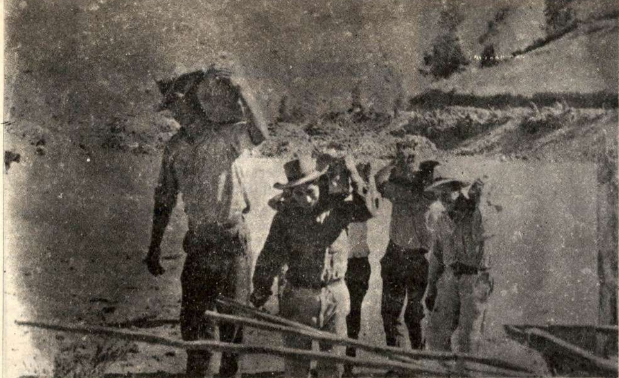
Los trabajadores agrícolas sufren la brutal sobreexplotación de parte de quienes saquean el agro peruano.