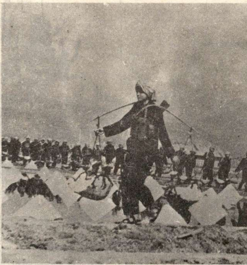
Se extiende la solidaridad internacional con Kampuchea Democrática, cuyo pueblo sigue combatiendo a la par que impulsa la producción en el campo.

"Desde hace cerca de un año, la pandilla de Le Duan no ha cesado de aumentar los efectivos de sus tropas en Kampuchea, y de multiplicar las operaciones de rastillaje y genocidio contra el pueblo de Kampuchea, sin tener en cuenta la oposición y condena unánimes del mundo y de toda la humanidad.