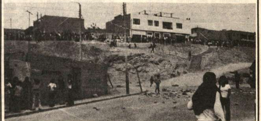
Ilo: El Pueblo Joven Alto Ilo es tomado por maestros y pobladores durante las heroicas acciones del 8 de agosto.