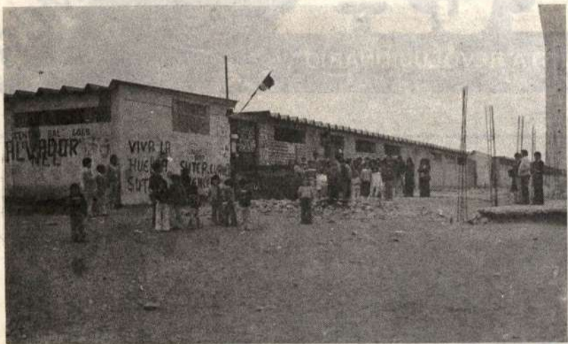
Villa El Salvador: Maestros, Estudiantes y Padres de Familia: Uníolos en la lucha.

Mientras la dictadura demora la ley electoral y acelera la represión a los maestros y el pueblo, la definición de los agrupamientos políticos se hace sobre una cierta apreciación común y generalizada: el gobierno que resulte del 80 será decidido por la correlación de fuerzas del Congreso Nacional. Esto exacerba la intensa pugna que entre sí tienen las variantes continuistas gran burguesas, así como el enfrentamiento del pueblo contra ellas.