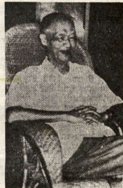
Hoang Van Hoan en la Conferencia de Prensa que dió en Beijing, China; el expansionismo Ruso-Vietnamita ha sufrido un nuevo golpe.