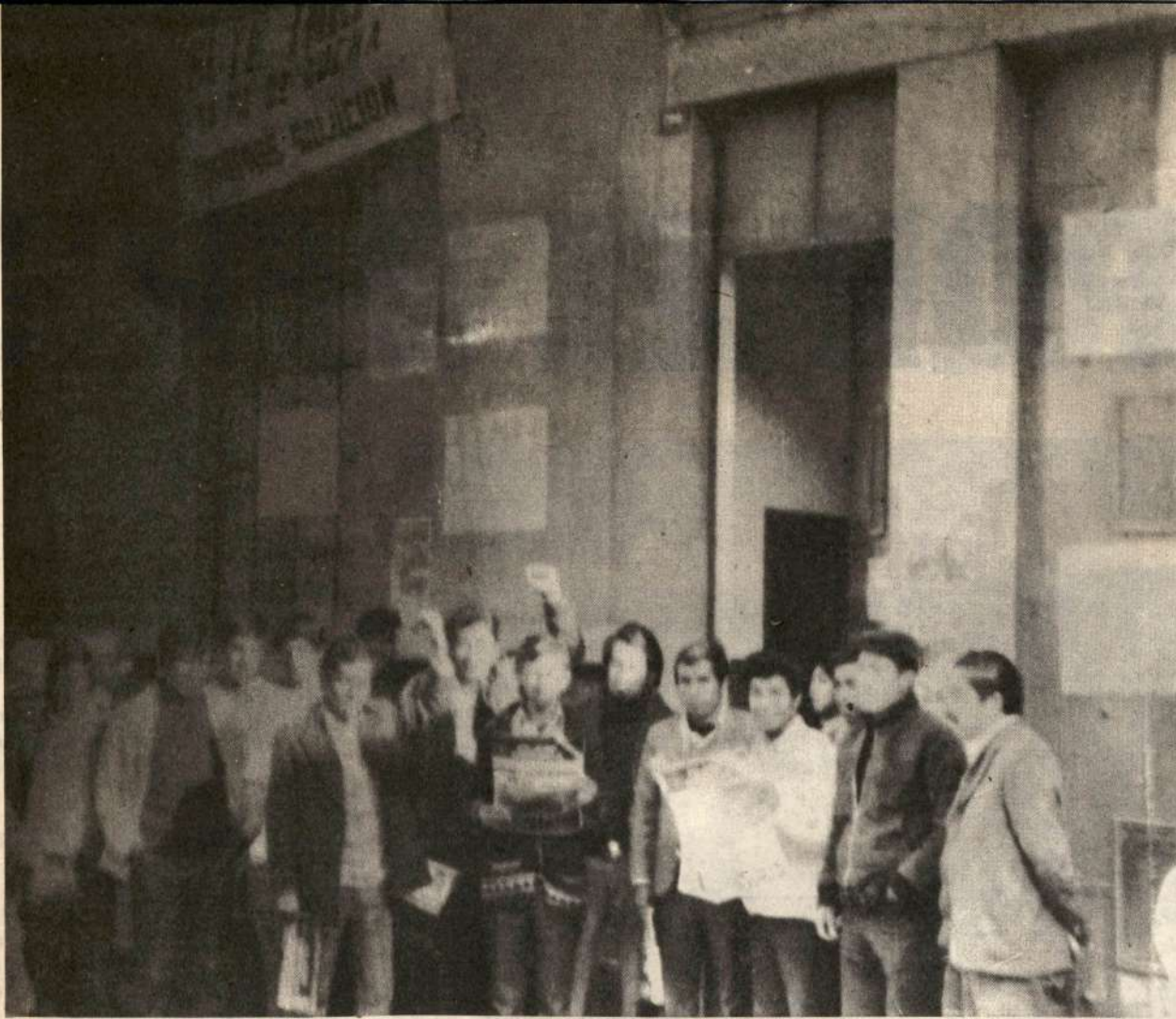
Maestros posan para CLASE OBRERA, burlando la represión luego de la toma