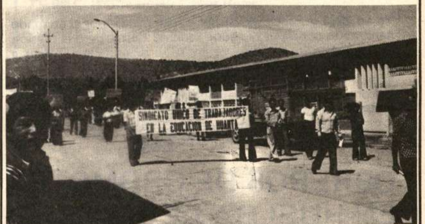
Huanta: Marcha del SUTE-H.