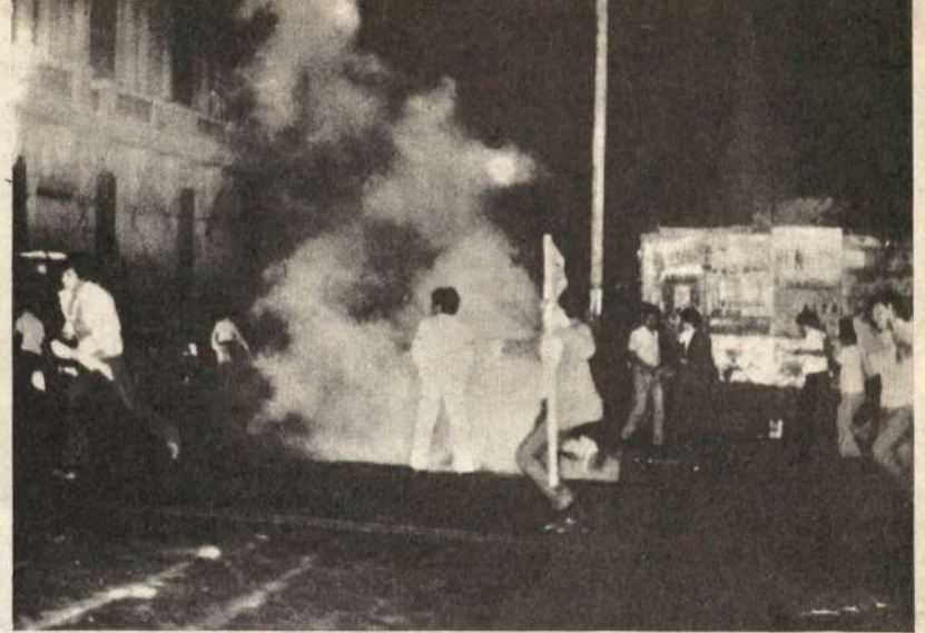
El Jueves 23 en la noche hubo fuertes choques entre manifestantes que apoyaban al SUTEP y efectivos de la GC, esto ocurrió alrededor de la Plaza San Martín entre 6.45 y 8 p.m.