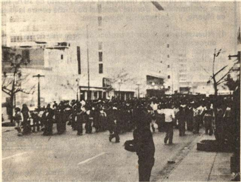
Las masas populares luchan por una Nueva Educación, la cual sólo podrá ser alcanzada cuando conquistemos el poder político

Los marxistas-leninistas afirmamos que la lucha de clases continúa bajo la Nueva Democracia y la Dictadura del Proletariado. La lucha entre el camino socialista y el de la restauración burguesa será cosa de todos los días. Sólo la participación decidida de las masas puede garantizar el triunfo del primero. La Nueva Educación participará de dicho proceso. Más aún, ella misma estará atravesada por la lucha de clases. A ambos niveles el papel que asignamos a la educación ideológica y política es clave.