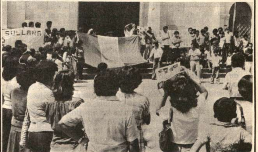
Mitin del SUTE-S