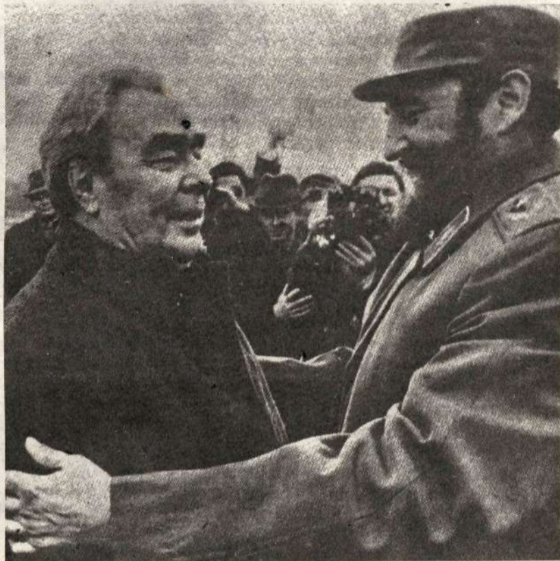
Castro y Breznev : Un abrazo muy alineado.

Muchos se preguntan porqué Cuba, que marcara un hito revolucionario en la lucha de los pueblos latinoamericanos por su liberación, se ha convertido de un tiempo a esta parte en peón del Socialimperialismo Soviético. La base de la política exterior cubana, abiertamente coludida al expansionismo soviético, se halla en la dominación neo-colonial que sufre actualmente el pueblo cubano. Las estadísticas comerciales de la Cuba de hoy, son casi iguales a las que existían antes de la revo-