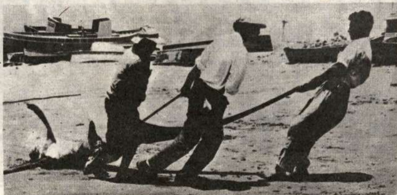
Nuestras riquezas marinas están en las 200 Millas. El nuevo atropello yanqui tratando de desconocer esto, no pasará.

A escasos días de la cumbre de los No-Alineados, el imperialismo yanqui ha virado de su posición de reconocer las 200 millas a no aceptar soberanía nacional sobre las mismas. Esta variación del imperialismo yanqui tiene a la base su acelerado debilitamiento mundial y pérdida de posiciones ante la URSS. De ahí que busca reconquistar terreno en la disputa con las otras superpotencias por el control de los mares. Este nuevo atropello imperialista es una provocación contra el Perú y América Latina, en momentos que la reunión de los No-Alineados, a celebrarse en Cuba, debe ratificar la lucha contra el imperialismo y el hegemonismo. Se suman los yanquis abierta y descaradamente a la disputa con la URSS para pescar a río revuelto dividen-