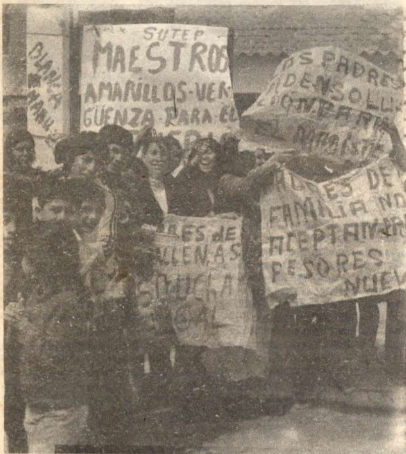
En esta nueva coyuntura, la centralización democrática del ascenso de masas, es el factor fundamental que acelerará las condiciones para la Revolución

Presentamos una parte del Informe Político aprobado en la VII Sesión Plena del Comité Central del PCR, el cual abordó como una de las cuestiones fundamentales la caracterización de la nueva coyuntura del 80 dentro del proceso de maduración de las condiciones objetivas para la Revolución en la actual situación pre-revolucionaria: En nuestro próximo número continuaremos con la siguiente parte, la crisis económica (temporal estabilidad financiera, pero con recesión), crisis política (nuevo aislamiento dictatorial), militarismo revanchista y tensiones fronterizas, y continúa el ascenso de masas.