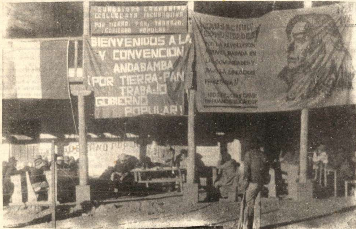
El campesinado de la Provincia de Acobamba -baluarte de la lucha contra el abigeato- asistirá organizadamente al Congreso Campesino de Huancavelica