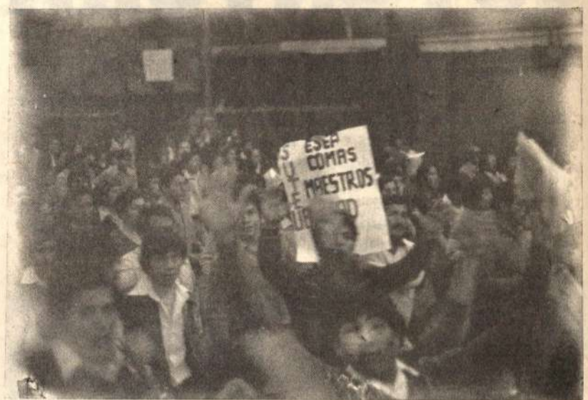
El SUTEP día a día viene ganando las calles, demandando la solución a su Pliego, la reposición de los subrogados, la libertad de los detenidos y el diálogo con el Gobierno.

Como no ha podido quebrar la Huelga del SUTEP, el Gobierno se ha jugado una nueva carta: recesar masivamente colegios a fin de amenazar a los padres de familia y estudiantes, haciéndolos que se reinscriban en otros Colegios. Si lo hubiera conseguido, habría resquebrajado la unidad entre maestros, padres de familia y todo el pueblo. Pero lo ha logrado en una ínfima medida, ya que la respuesta popular fue tomar masivamente los locales escolares desde el 13 de Agosto, cuestión que golpeó duramente al Gobierno el cual lanzó una brutal contraofensiva para el dasalojo. Pero los maestros no se amilanaron en ningún momento, habiendo desarrollado heroicas acciones como el bloqueo de la Carretera Central a la altura de la Oroya; el tomar por unos minutos una radio en Chimbote y lanzar una breve proclama en pro de la Huelga Magisterial; la toma de la Catedral de Arequipa apenas minutos después que la GC había allanado el local del SUTE-A, obligando a una negociación inmediata, a todas luces constituyó una victoria de los maestros, etc. vienen demostrando que la huelga sigue firme. Las huelgas de hambre en La Oroya, Jaén (10 cc.), San Ignacio (2 cc.), Huancayo, Cusco, etc. y la toma del local de la OEA en el Perú por segunda vez, revelan la gran disposición de un magisterio que no se somete sino que sigue luchando hasta vencer.