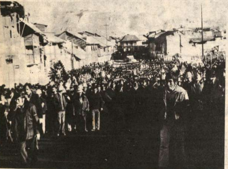
La multitud se acerca a la Plaza de Chaupimarca. En ese momento la masa cubría ya más de 6 cuadras.