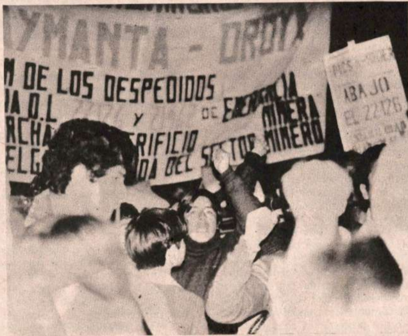
MINEROS PREPARAN CONGRESO DESDE LAS BASES

podido impedir la victoria clasista. La ofensiva feccionaria desatada debe sin embargo tensar fuerzas en el clasismo, más ahora que la realización del próximo Congreso de la Federación Nacional de Trabajadores Mineros y Metalúrgicos del Perú que ha sido fijado del 4 al 8 de Julio y en el que la Izquierda Revolucionaria, trabajando en un Frente Unitario, debe dar un golpe definitivo al Apra y desenmascarar al revisionismo traidor del PC "U" y al divisionismo de oportunistas que como Díaz Chavez, pretende seguir utilizando a los mineros. Este próximo evento, no es sólo importante para el proletariado minero; lo es para el conjunto del Movimiento Obrero y Popular. El fortalecimiento de la Federación Minera, signo del clasismo y un avance en la lucha por la centralización sindical y la garantía de un bastión consolidado para los próximos enfrentamientos con los enemigos de clase.