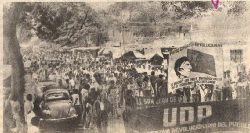
La UDP es una de las fuerzas fundamentales en la forja de la unidad de la izquierda

A.S.: Actualmente hay un repliegue Temporal en el movimiento obrero por responsabilidad del revisionista PC-"U" encaramado en la