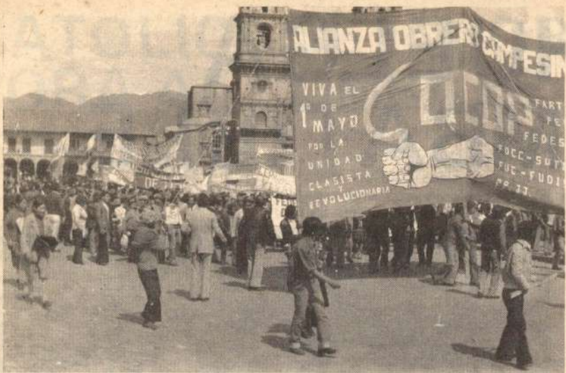
El COCOP sigue al frente de las luchas populares cusqueñas