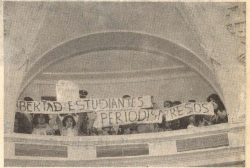
Estudiantes de periodismo exigen la libertad de sus compañeros presos durante una plenaria de la Constituyente.

LIMA: igualmente es exitosa, a pesar que aquí se han concentrado los esfuerzos de la Dictadura Militar mediante los funcionarios del Ministerio de Educación, los amarillos y matones apristas y los de la PIP y GC; en particular en los Sectores 4to. (Surquillo), 6to. (Magdalena, Jesús María San Miguel), 7o. (La Victoria), 9o. Vitarte, 12o. (Cono Norte), 13o. (Villa El Salvador), 14o. (San Juan) es total, y en el resto es superior al 80 o/o.