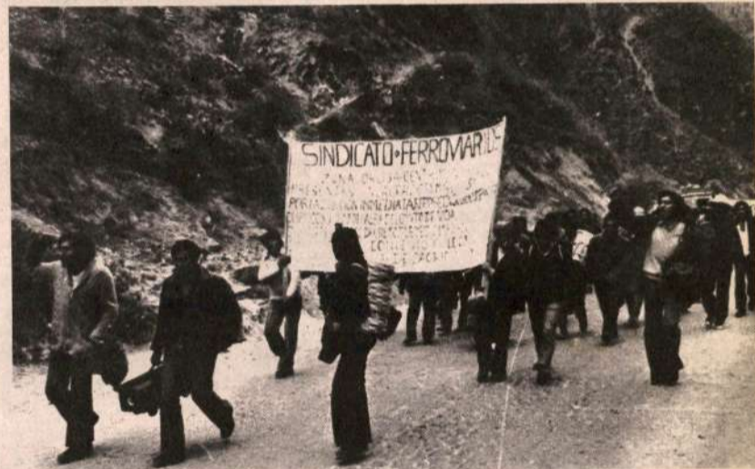
FERROVIARIOS EN LUCHA POR SU PLIEGO

El PCR saluda esta gran victoria del clasismo, y estamos seguros que la nueva dirigencia conducirá a los trabajadores hacia nuevos y mayores triunfos.