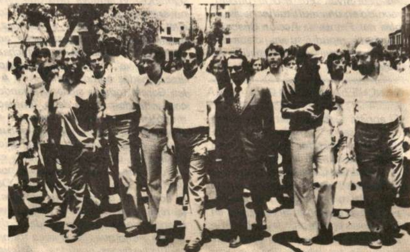
FOCEP, PC del P, UDP, junto con el PSR, VR-PC, PSR-ML y demás fuerzas populares avanzan en la forja de la unidad de la izquierda combatiendo al divisionismo