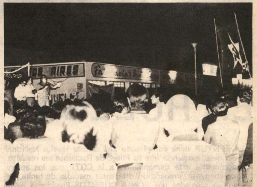
El PCR y la izquierda a la cabeza del combate contra el APRA en Siderperú