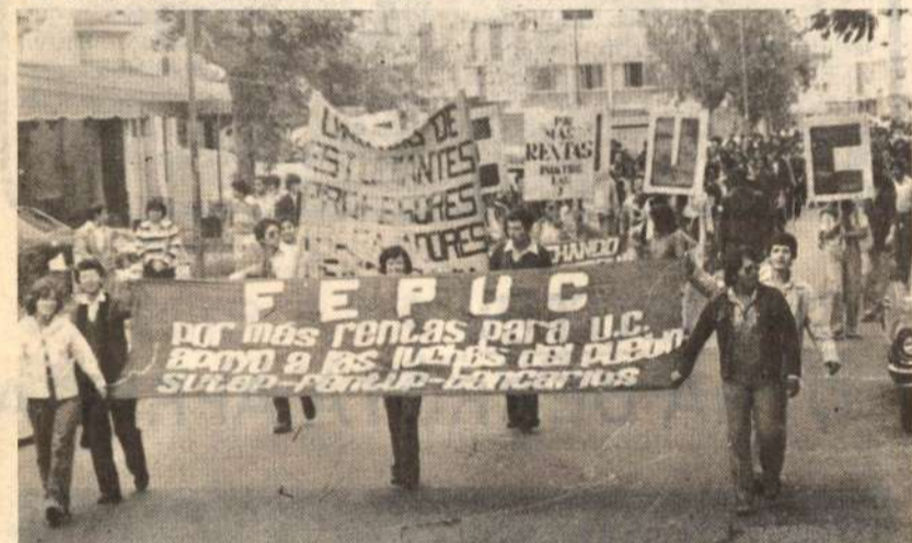
Católica: Estudiantes y trabajadores en la masiva marcha callejera de día 25

La Católica con su lucha, deberá motivar que las demás Universidades Particulares se plieguen a esta medida, y con la unidad que se forje, deberá señalar el camino como en San Marcos y la UNI; el de la unidad férrea e imparable de los tres estamentos.