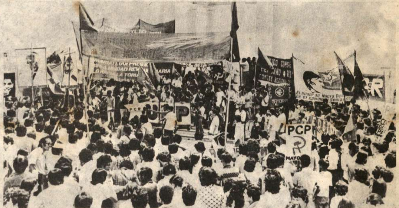
Mitin ante la tumba del Amauta Mariátegui realizado después de la Romería convocada por la UDP, FOCEP, PSR, VR(PC), PSR-ML, PC del P y PC-M