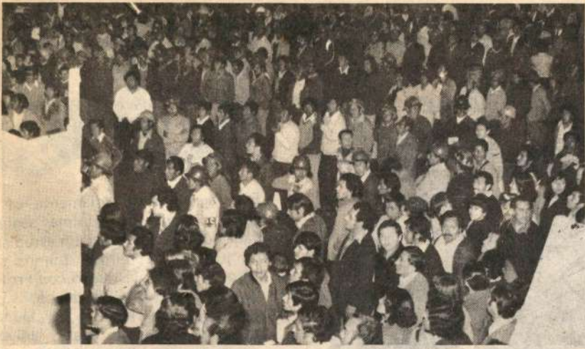
Los mineros, junto a todo el pueblo, siguen luchando contra la dictadura