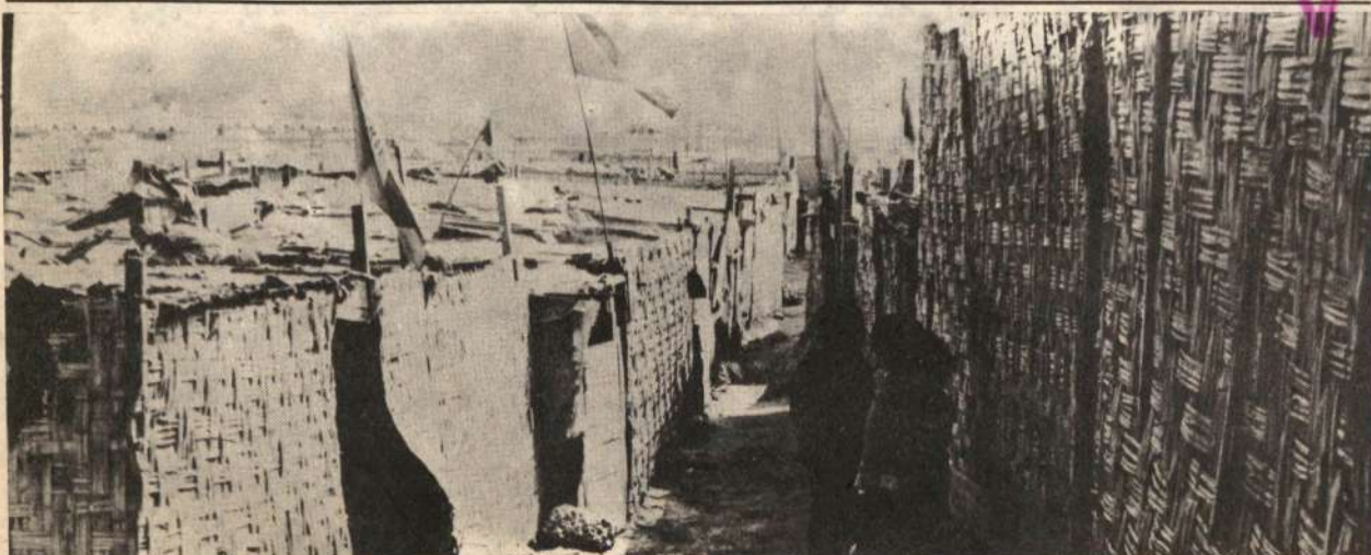
Mientras la Dictadura Militar importa artículos no prioritarios, las condiciones de vida del pueblo van empeorando día a día.

Morales, deseoso de candidatear, está dándole un toque personal a este paquetazo. De ahí que planteó una campaña de construcción de viviendas masivas, bajo el señuelo de dar trabajo, casa y salarios. ¡Esto es pura demagogia! y lo plantea haciendo obligatoriamente los fondos del propio salario de los trabajadores, y con jugosos préstamos financieros del imperialismo. Y algún negocio sucio particular debe haber, cuando según diversas fuentes, se "empezará", comprando el Programa Habitacional de San Juan de Miraflores. Pero el pueblo ya sabe que alguien, de la camarilla gobernante, se va a beneficiar de esto ¿Será algún familiar de General? Serán los apristas con Ponce de León a la cabeza? Ya lo denunciaremos.