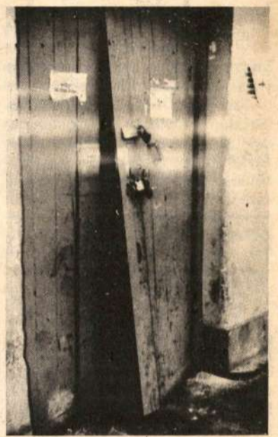
Así quedó la puerta de Sindicato luego de ser violentada