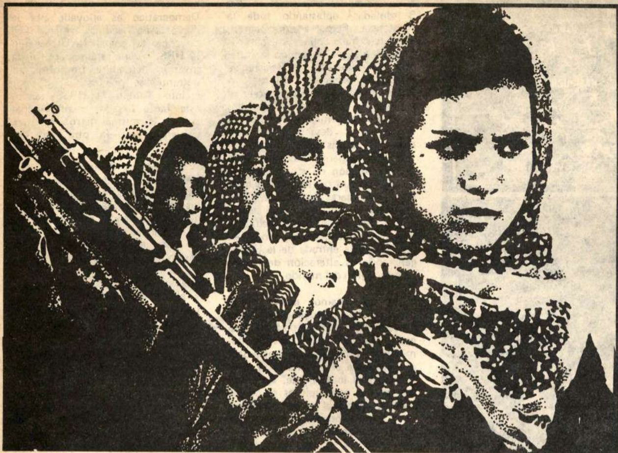
El pueblo palestino, representado por la OLP, defiende sus derechos nacionales y conquistará la victoria.