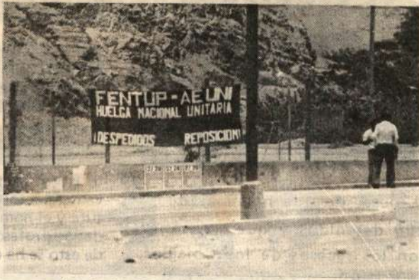
La FEP debe unificar las luchas estudiantiles con las de la FENTUP y la FENDUP

ESTUDIAR Y LUCHAR POR LA LIBERACION NACIONAL DEMOCRACIA POPULAR Y POR EL SOCIALISMO Federación de Estudiantes del Perú CONTRA LA POLITICA EDUCATIVA DE LA DICTADURA MILITAR Y SUS IMPLEMENTADORES IMPULSORES DE LA ACCION DIRECTA DE LOS TRES ESTAMENTOS Y AUTONOMIA FORJANDO LOS F