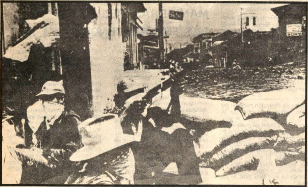
La antorcha de la Liberación Nacional se ha prendido en Nicaragua con el FSLN

algunos dirigentes sindicales, inclusive esos "avivatos" de nuestra izquierda, con miras a ganarse una base de sustento. La Socialdemocracia sabe de la debilidad yanqui y está jugando a ser la carta de su reemplazo. El tercer aspecto en su actual comportamiento, es el de buscar facilidades de la URSS, sin romper sus lazos con EEUU, pensando inutilmente que así desvían los factores de guerra a otras zonas del mundo. El viaje de Giscard últimamente a la URSS apunta a esto en última instancia. Es importante señalar como el comportamiento de la burguesía monopolista y la socialdemocracia ha ido quitando espacio político