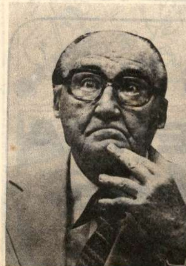
¿Towsen?, ¿Villanueva? o MORALES

Esta situación deja al desnudo la significación real que, políticamente, ha tenido la Constituyente: ha servido para darle aire a la dictadura, y ahora esta continuará enfrentando las luchas populares y gobernando contra la mayoría del país. Una Dictadura Militar que se siente fortalecida, Chauvinista, con un Presidente autoproclamado candidato, buscará imponerse con las fuerzas de las armas al ascenso