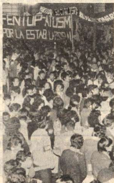
FENTUP: Firmes en la lucha.

una nueva agresión; está llamándose a "Exámenes de Regularización" y "Complementación" de asignaturas que ya fueron evaluadas antes del receso, arguyéndose que "se han perdido las actas"; para ello no se sacan avisos en los periódicos (la mayoría de estudiantes están fuera de Lima por ser de provincias), y obviamente la concurrencia es escasa. Con ello se busca eliminar