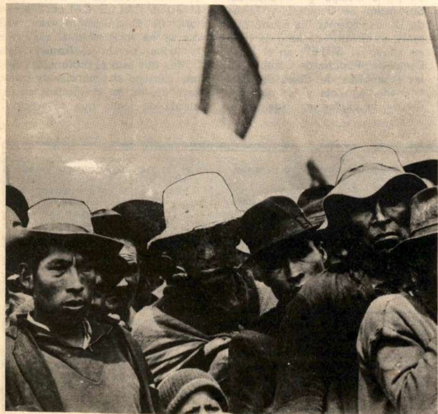
QUECHUAS CONTRALAS MANIOBRAS DE LA DICTADURA MILITAR-APRA-AP-PPC.

Los aymaras, aglutinados en su Federación TUPAC KATARI también están demandando la oficialización del idioma aymara; ambas cuestiones las apoyamos decididamente y llamamos a todas las fuerzas progresistas a cerrar filas contra esta nueva agresión reaccionaria.