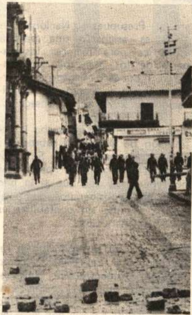
Represión Antiestudiantil en el Cuzco

como el de Medicina, que realiza en forma exitosa una Marcha de los Mandiles, que conjuntamente con otras bases congrega a más de 3,000 estudiantes, que en forma disciplinada y con numerosas banderolas, levantaron la exigencia de un Hospital Docente (San Juan), para San Marcos, es decir el reclamo de mejores condiciones de estudio y contra la elitización de la carrera, junto a la cual las banderas de reforma de la enseñanza médica, sistema facultativo y terciario y gobierno, va ganando la comprensión y asunción de cada vez mayores sectores estudiantiles, sobre todo cuando un aspecto central de esta lucha y que ha perfilado su contenido, ha sido el claro enfrentamiento a las fuerzas apristas, y las otras fuerzas reaccionarias encaramadas en el Consejo Ejecutivo y la Dirección de Programa.