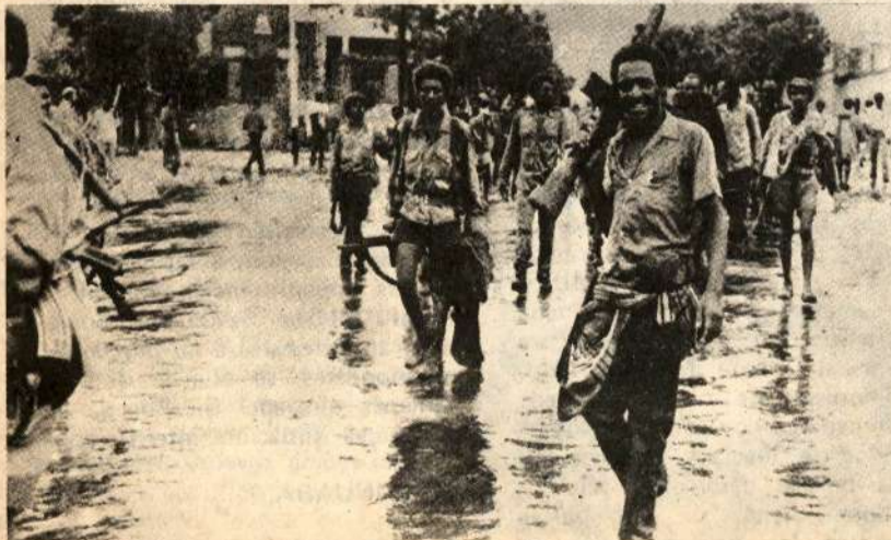
Momentos en que las tropas del FPLE Entran vencedoras a la segunda ciudad de Eritrea

La justa lucha del pueblo Eritreo sabrá dar una lección a esta nueva potencia que se disfraya de socialista, la URSS, así como a Cuba y al reaccionario régimen Etíope. El pueblo y el FPLE vencerán.