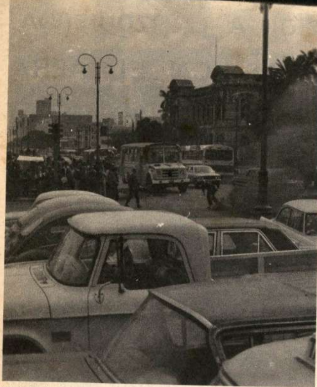
Venciendo la represión y el divisionismo, a desarrollar la batalla de Junio