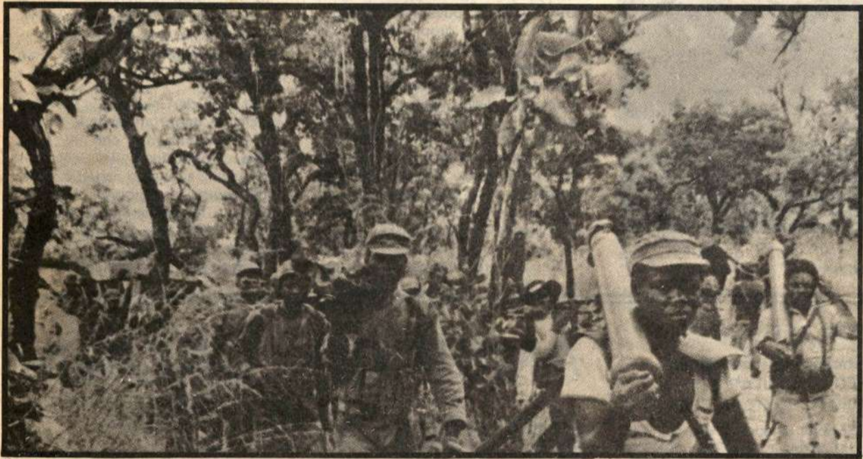
Con las armas en las manos, los pueblos africanos conquistarán la independencia y acabarán con el régimen racista de Smith.