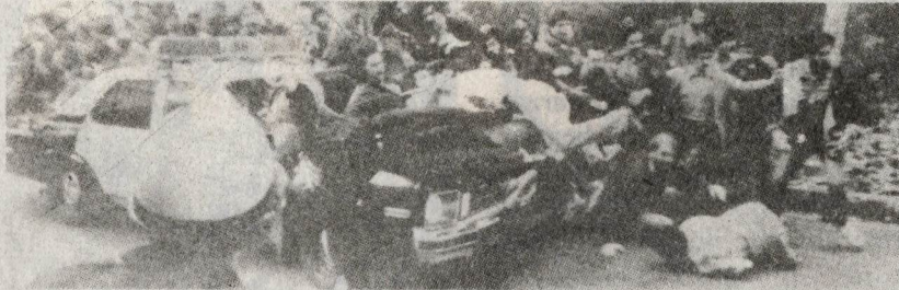
Manifestación anti-Sha en EE.UU —sostén político y militar de la sangrienta dictadura monárquica—, es salvajemente reprimida por los "guardianes del orden y los derechos humanos".

L A apresurada fuga del Sha de Irán, Mohamed Reza Pahlevi, ha sido motivo de una gran fiesta nacional en este país. Ha significado una gran derrota de la monarquía iraní y del imperialismo yanqui que la sostenía. Una movilización de más de millón y medio de personas, cuyas columnas cubrían una extensión de 30 kilómetros, ha sido la rúbrica con que las masas han sellado su total repudio al reaccionario régimen del Sha y su deseo de establecer una República Democrática e Islámica.