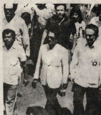
Barrantes siempre ha pugnado por la forja de la unidad

nes electoreras que son propias de los empedernidos reformistas.