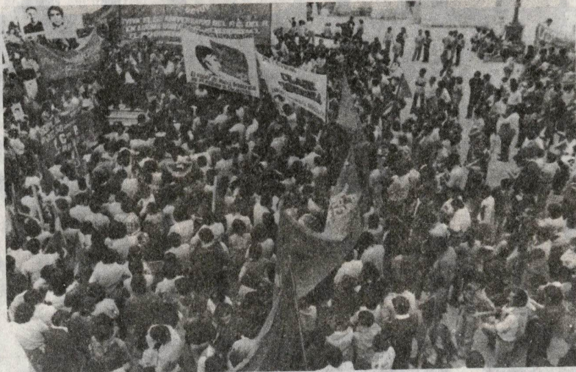
CLASE OBRERA, portadora de los intereses de las clases revolucionarias del país.

Los Objetivos Centrales que la situación plantea: Dentro del campo popular, debemos intensificar el combate contra el reformismo en general, y en particular contra el revisionismo por cuanto constituye la traba principal para el desarrollo de la revolución en el seno del pueblo... En el seno de las fuerzas de izquierda, debemos combatir las posiciones espontaneistas-aventureras del trotskismo y del reformismo - insurreccionalista, combate que debe desarrollarse a partir de la derrota sufrida por estas posiciones de manera contundente por el fracaso del Paro... Desarrollar y consolidar la política de alianzas con el FOCEP, PSR (ML), PCP (M), P.R., V.R(PC), Comando Político Popular, en función de confluir en un solo Frente Popular Revolucionario en base a nuestros lineamientos programáticos (Gobierno Popular Revolucionario) y Plataforma Política".