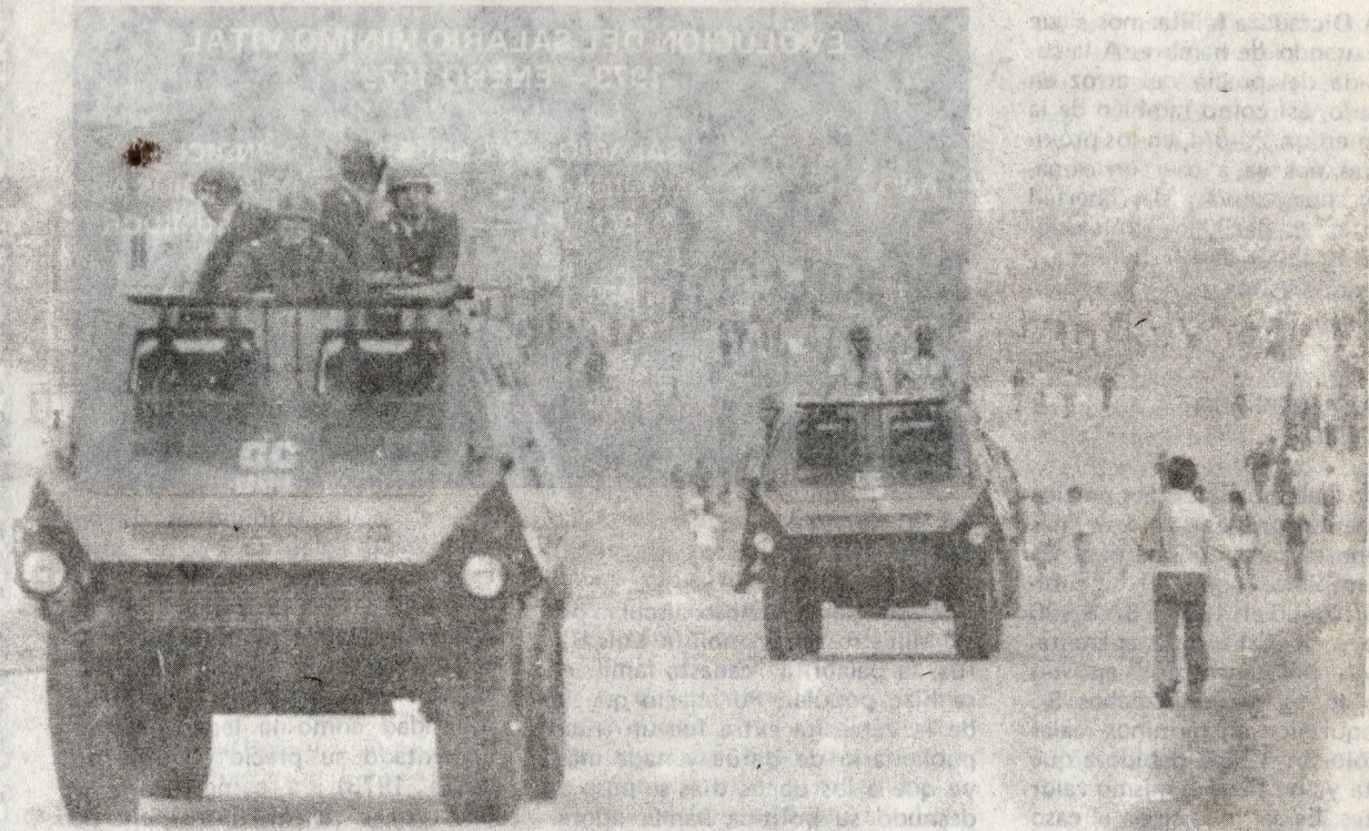
El gobierno de la dictadura militar para mantener el poder del estado burgués, se ha empeñado en la represión contra el pueblo.

Afirmando los logros obtenidos en el Paro, en particular en Sider-Chimbote, Anta-Cusco-Ayacucho y el Cono Norte en Lima, hay que avanzar sin transar en la lucha popular. Así, sacando lecciones de nuestros aciertos y errores, no iremos preparando para las próximas batallas, fortaleciendo la Unidad Revolucionaria en la lucha y para la lucha.