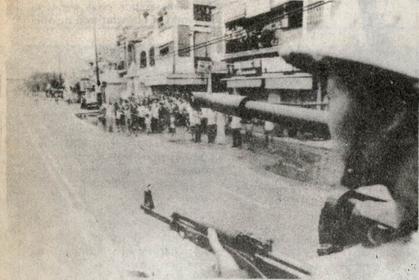
"El pueblo de Kampuchea resistirá hasta vencer al agresor vietnamita".

O TRA PERSONA PREGUNTO: ¿Qué es la resistencia de todo el pueblo?. LE RESPONDI: Eso quiere decir que todo el pueblo combate al enemigo. Hombres y mujeres, ancianos y niños, todos participan en la resistencia. La Patria es común. Si la Patria es independiente, todo el mundo goza de la libertad. Si perdemos el país, todo el mundo será esclavo. Tíos y tías, ¿quieren ser esclavos? No. Hermanos y hermanas, ¿se resignarán a ser esclavos? No. Mis sobrinos, ¿quieren ser esclavos? ¡No Categóricamente no!. Entonces todo el mundo tiene el deber de participar en la resistencia". (Escritos del Presidente Ho Chi Minh, diciembre de 1946).