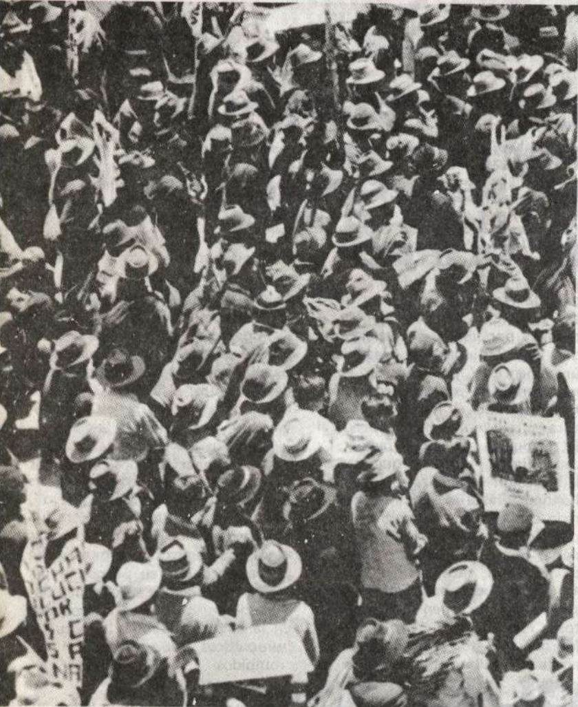
A lo largo y ancho del país, el campesinado se prepara para la situación revolucionaria próxima.