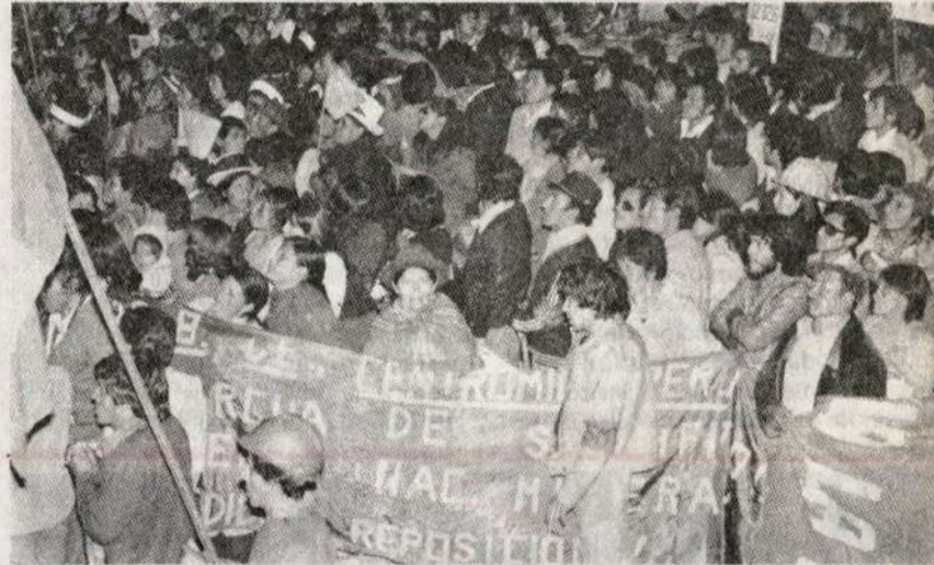
El proletariado minero se prepara para nuevas jornadas de combate

Llamamos a votar por la lista de la Unidad Clasista que defiende los intereses de los mineros: el FRENTE CLASISTA ROJO.