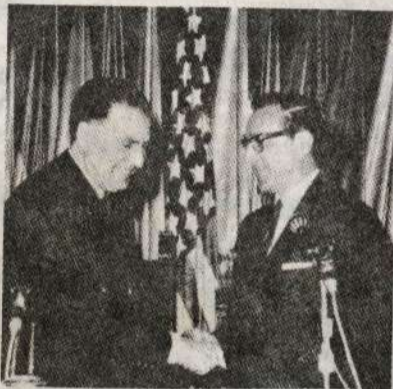
APRETON DE MANOS CONTRA EL PUEBLO

El 28 de noviembre se realizó un paro de los obreros y empleados de Faucet que están agrupados en un Frente Unico. Fue la muestra más rotunda de que la millonaria propaganda por tie-