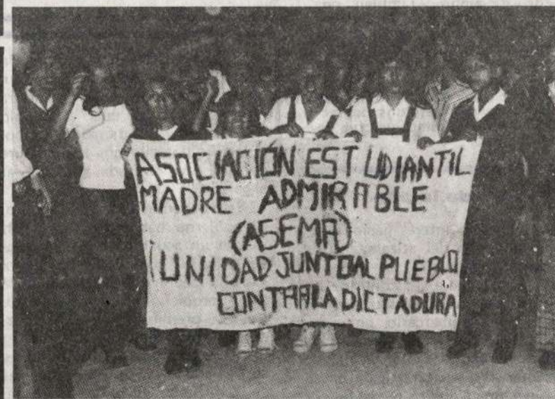
En vísperas a la situación revolucionaria, los escolares entran victoriosos a la nueva oleada de lucha popular.