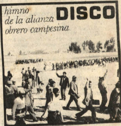
himno de la alianza obrero campesina DISCO

do Begin y su partido Likud, quien hábilmente ha aprovechado la oportunidad para presentarse ante la opinión pública mundial como "sincera" "amante de la paz y la concordia".