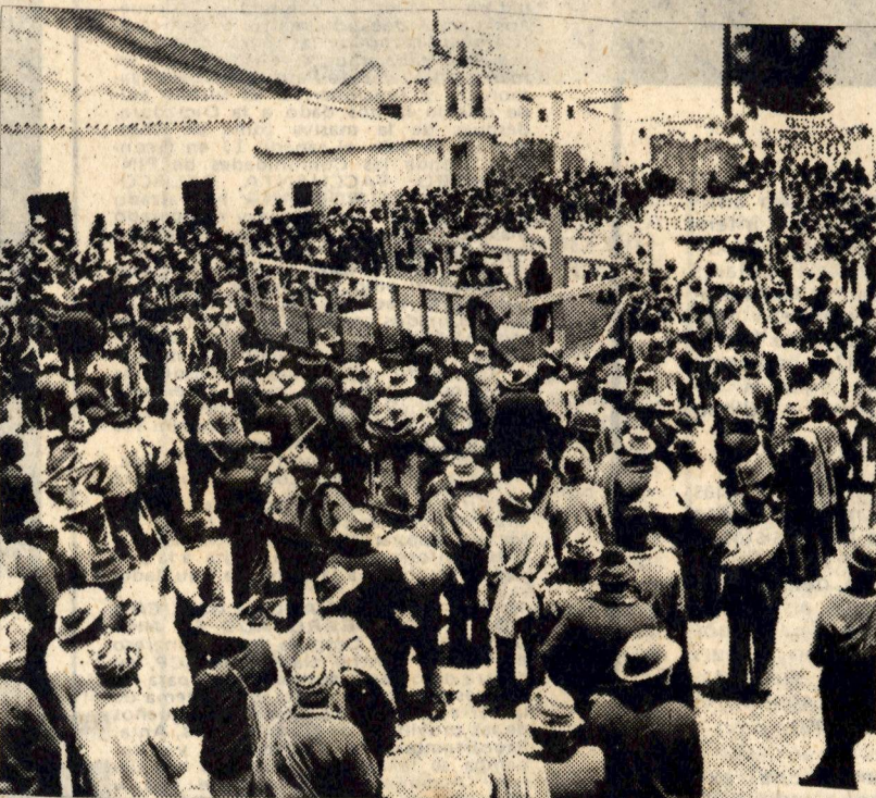
A las elecciones de la dictadura, el campesinado le opone su lucha de masas y sus propias formas de elección directa, democrática y representativa.

Hasta el mes de diciembre, por todo el país, se realizarán las elecciones de autoridades en las Comunidades Campesinas. Este bastión fundamental de nuestra nacionalidad y de las masas campesinas, que está al frente de las acciones de tomas de tierras, debe movilizarse activamente por su autonomía por sus derechos sagrados e históricos por la tierra, y por la plena vigencia del ejercicio de la democracia de masas en su seno. Serían así desba-