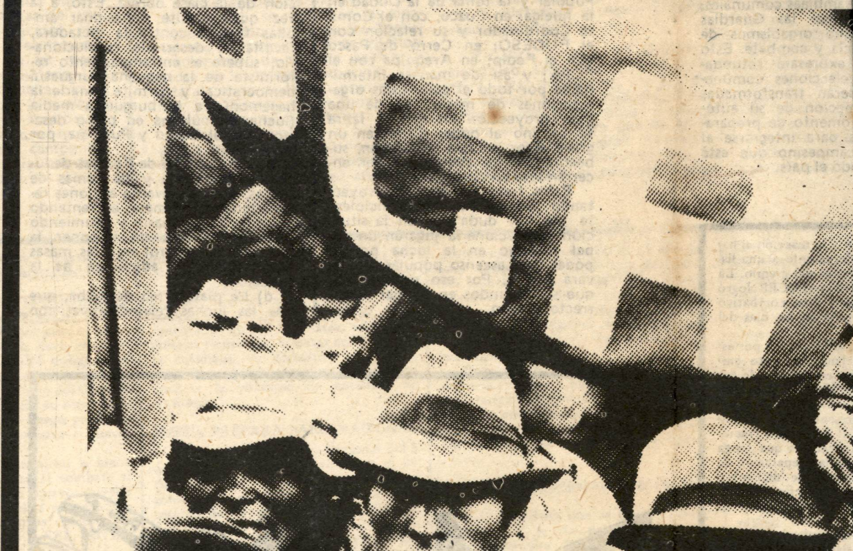
El PCR se ha ganado un lugar de vanguardia en los combates y en los corazones del campesinado revolucionario.

Sin embargo, lo más importante es que la fuerza desplegada del campesinado asusta al revisionismo y a la burguesía a tal punto que se unen para disputar al clasismo la