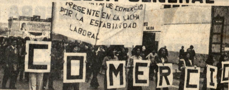
Este viernes 17, la CITE nuevamente se lanza a las calles junto a maestros, padres de familia, estudiantes, bancarios, trabajadores de la universidad y todo el pueblo.

Es importante señalar que pese a la brutal acción represiva sobre las movilizaciones de estatales, éstos se reagrupaban sucesivamente sin perder su capacidad de combate. Hasta