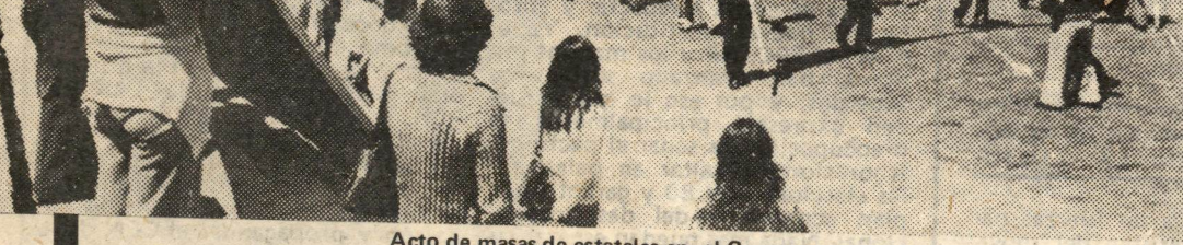
Acto de masas de estatales en el Cusco: preparan huelga.

pueblo cusqueño en la lucha! A la 1 p.m. la Plaza de Armas ya estaba en manos de un pueblo que nunca se somete y que hace de su rebelión cotidiana el germen de su organización para luchar por la Revolución. Luego de efectuar un mitin con más de 5 mil asistentes, se marchó a la Prefectura a exigir la libertad de los detenidos, de cuyos balcones hicieron uso de la palabra varios dirigentes populares, para luego emplazar al Prefecto a que libere a todos los presos, cuestión que 1 hora más tarde fue conseguida.