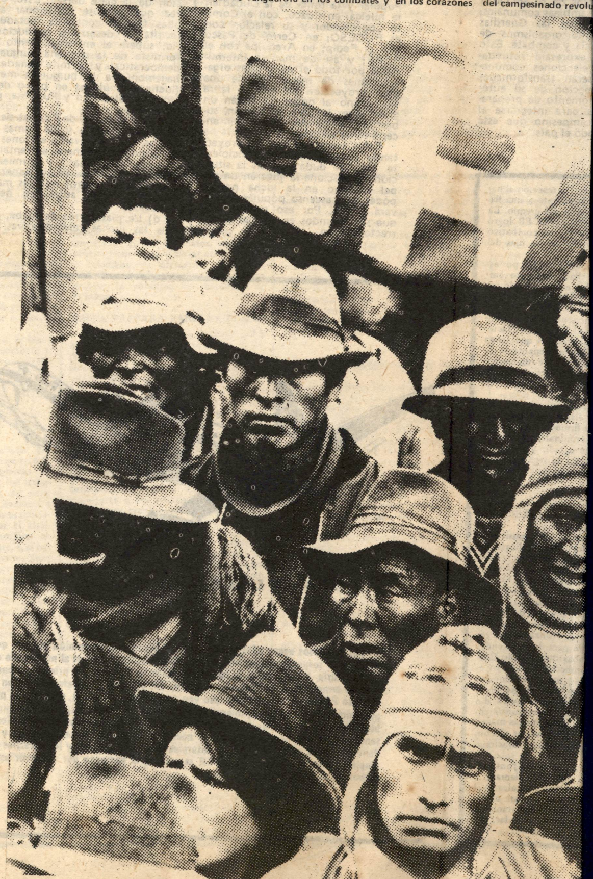
El PCR se ha ganado un lugar de vanguardia en los combates y en los corazones del campesinado revolu

La FUC está de nuevo en manos del clasismo. El PCR, firmemente comprometido en su dirección, saluda este gran triunfo y señala que luchará indeseablemente por mantenerla bajo una orientación efectivamente revolucionaria.