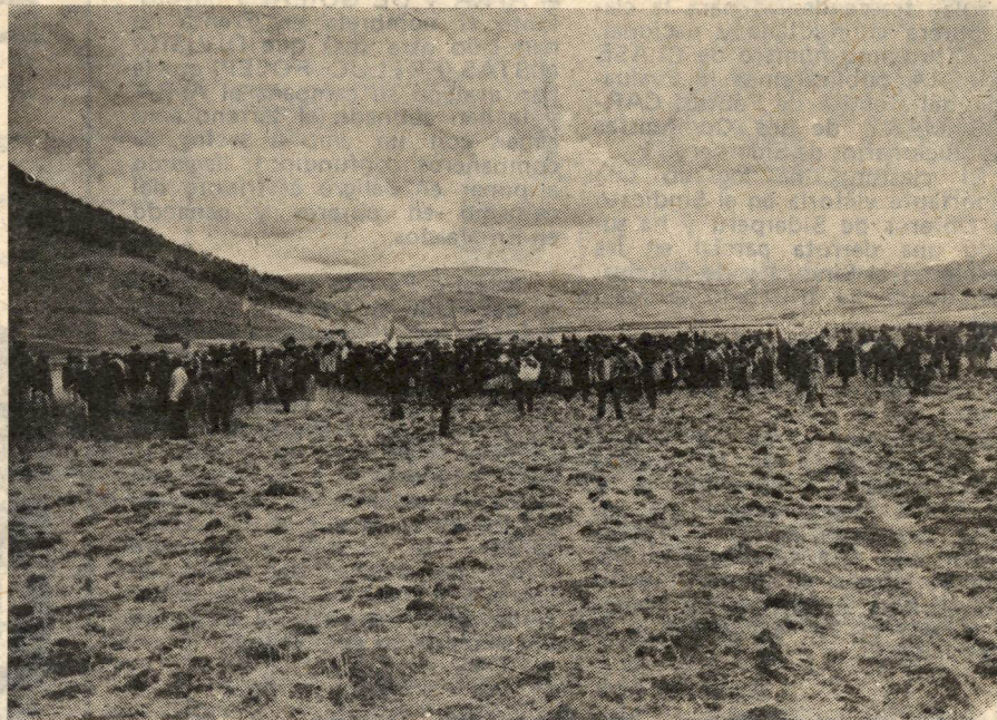
Pese al reformismo, las mentiras de los oportunistas, las tomas continúan exitosas