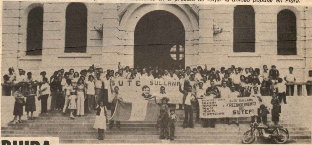
El SUTE - Sullana es un importante destacamento en el proceso de forjar la unidad popular en Piura.

Finalmente, expresamos nuestro agradecimiento a vuestro director y demás colaboradores por mostrar interés en la defensa de nuestros derechos.