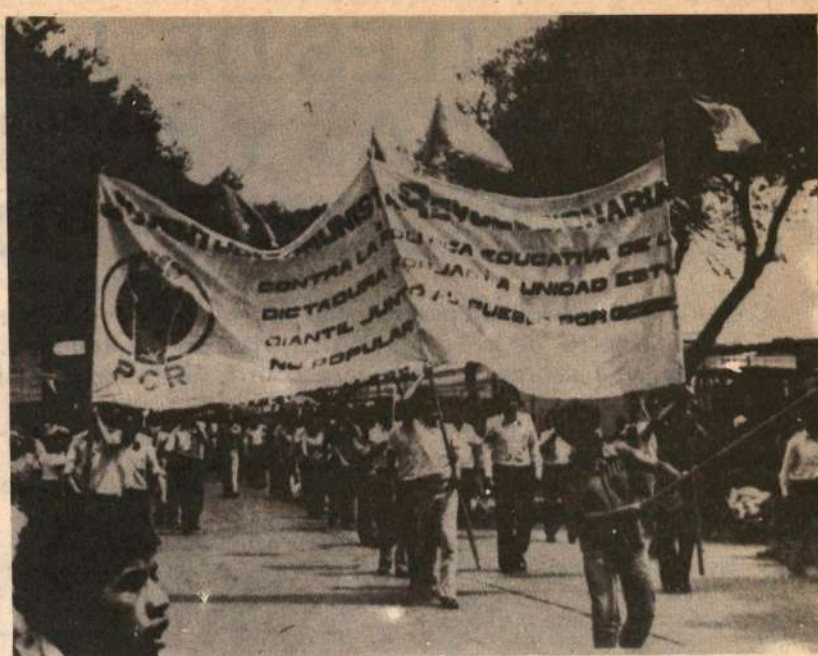
La Juventud Comunista Revolucionaria (JCR) sigue estando a la cabeza de la Unidad del Movimiento Estudiantil Sanmarquino, decantando con quienes impiden su fortalecimiento.