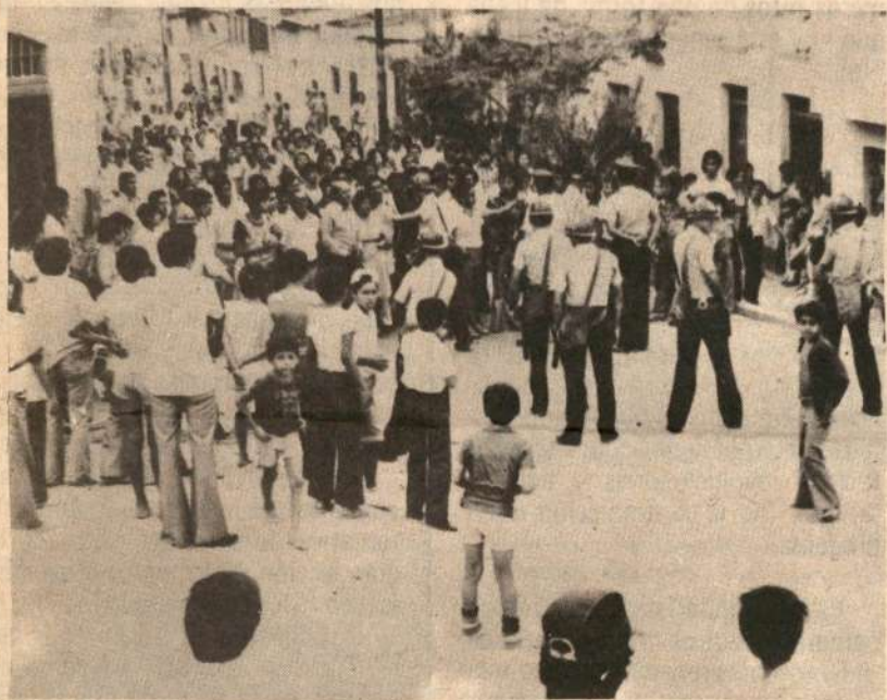
El atemorizamiento y la represión policial no han podido impedir la movilización organizada de los maestros.