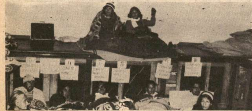
Huancayo: maestros en Huelga de Hambre en diversos colegios de la III Región vienen ratificando su gran espíritu de lucha.

El principal acuerdo de la reunión fue manifestar su apoyo a la indoblegable Huelga Indefinida del SUTEP, exigiendo el Trato Directo del Gobierno con sus dirigentes; asimismo, se acordó apoyar al campesinado del Alto Piura, oponerse a la Pena de Muerte, solicitar restitución de las garantías suspendidas en Ilo, la derogatoria del DL. 22162 que atenta contra la autonomía de los PP. JJ., y que se aumenten las rentas para la U. Peruana.