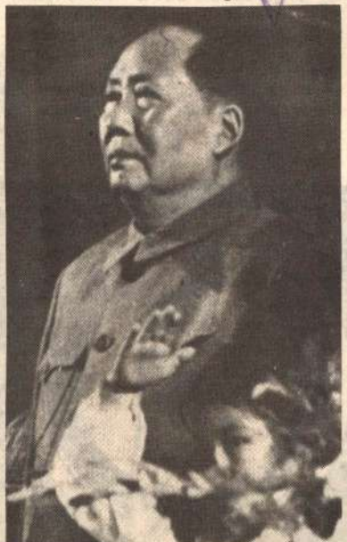
Camarada MAO-ZEDONG: su pensamiento y su obra constituyen un gran legado para los revolucionarios

En este tercer aniversario de la muerte del Camarada Mao, el PCR y todos los revolucionarios peruanos y del mundo entero renovaremos nuestro juramento de seguir su correcta línea Marxista-Leninista; asimismo, hacemos votos para que la construcción del Socialismo en China se consolide impulsándose la política de las Cuatro Modernizaciones bajo la conducción del Camarada Hua Guofeng.