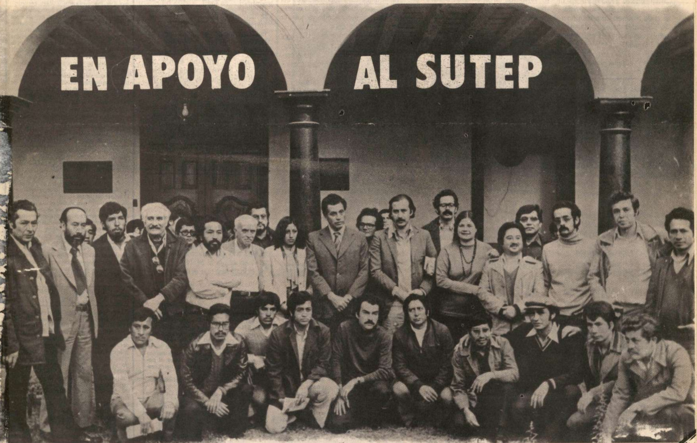
LUNES 3, 5 p.m.: 32 DIRIGENTES DE IZQUIERDA INICIANDO HUELGA DE HAMBRE EN LA CASONA DE SAN MARCOS